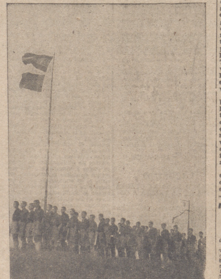
Nuestros camaradas del Campamento «Felipe II», en formación