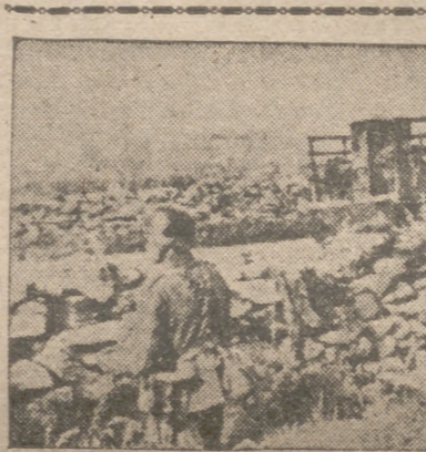
Los primeros infantes alemanes llegan a las afueras de un pueblo, donde resisten fuerzas enemigas. Mientras llegan más refuerzos, los soldados alemanes están preparados para impedir una reacción soviética

graves pérdidas. Un barco de 18.000 toneladas y dos petroleros fueron alcanzados e inmovilizados por el fuego de estas lanchas. Las unidades pesadas de la flota italiana no tuvieron ocasión en esta batalla de abordar a los acorazados ingleses que se destacaron del convoy para regresar a Gibraltar.—Efe.