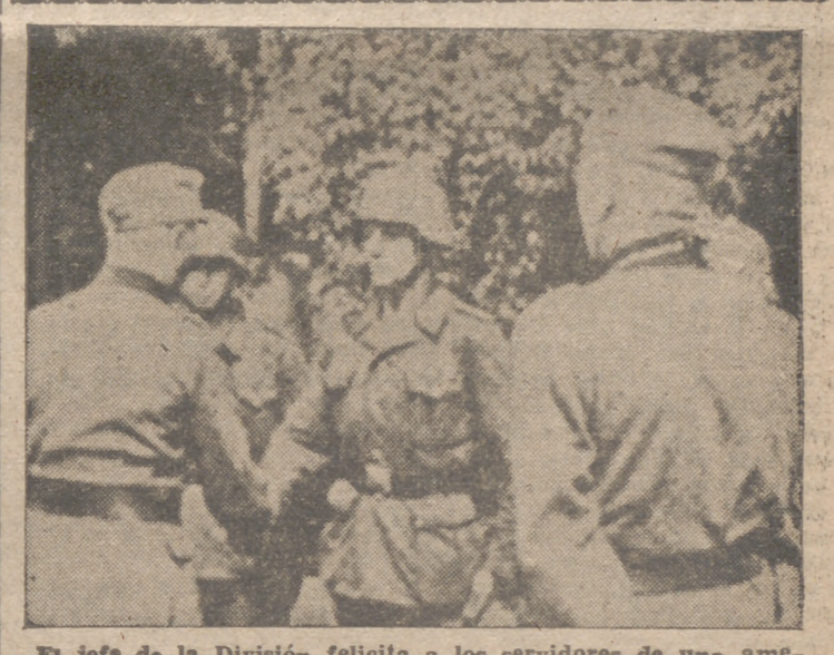
El jefe de la División felicita a los servidores de una antiaérea alemana que ha derribado dos cazas británicos sobre la costa francesa del Canal