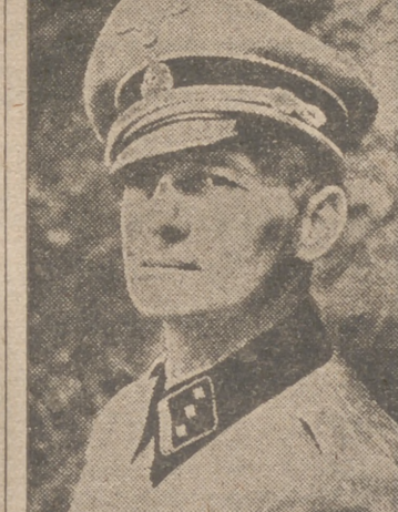
El primer comandante del Cuerpo de voluntarios "Dinamarcos". Uno de los héroes caídos por la nueva Europa.

Las pérdidas germano-italianas (Passa a la última página)