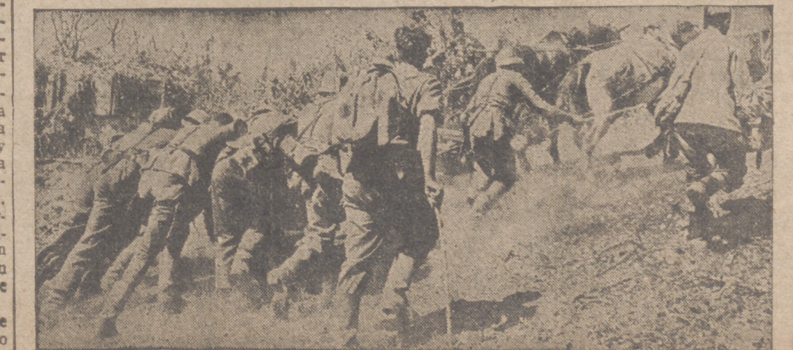
ARTILERIA ALEMANA EN DIRECCION A LAS PRIMERAS LINEAS.