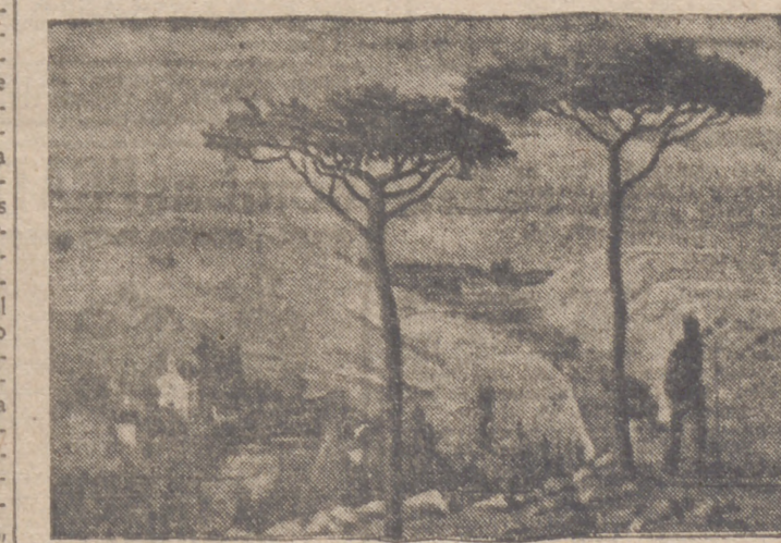
Uno de los cuadros más meritorios de la Exposición de Arte de "Educación y Descanso", cuyo autor es el artista E. Viana.

Cooperación Social y otros numerosos camaradas, todos los cuales, así como los artistas expositores y numeroso público, visitaron detenidamente las obras expuestas, haciendo elogios al mérito de casi todas ellas.