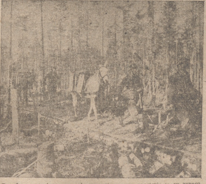
Con frecuencia las tropas alemanas tienen que construir en su avance pistas de madera...