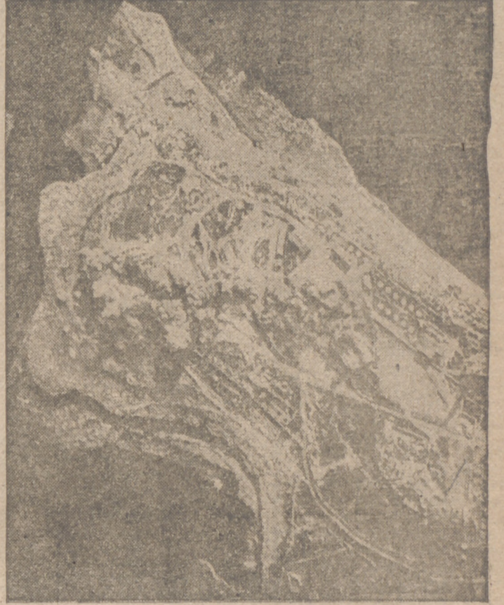
Este pico rocoso frente a La Valetta, en el que se hacían especialmente las fortificaciones costeras y los emplazamientos de la D. C. A., es objetivo predilecto de las bombas