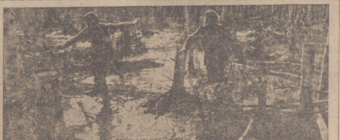
El suelo ruso está cubierto en enormes extensiones por pantanos, que constituyen un fuerte obstáculo para la progresión germana. He aquí un trozo de bosque pantanoso ocupado alemanamente

La oportunidad subjetiva y la orientación objetiva de esta medida es digna de encomio, pudiendo a resolver un problema de tanta importancia que aun en países de más potencia industrial que el nuestro—tal es el caso de Inglaterra—se apresuraron a resolver apremiados por las circunstancias.