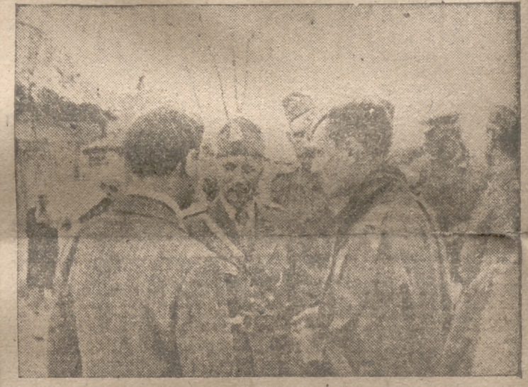
Corresponsales de Prensa extranjera han visitado los campos de batalla de Jarkov.—Un corresponsal rumano hablando con un jefe de tropas rumanas

Y así pasan los días y van viendo los pobres niños vagabundos del paraíso soviético!