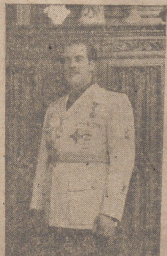
Trabajadores: Cuando andamos faltos de pan y en dura lucha por la justicia, parece poco oportuno hablar de la Patria; pero para nosotros están tan enlazados estos tres conceptos, que por cualquiera de los tres caminos llegamos a las mismas consecuencias.