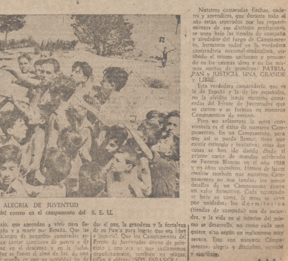
ALEGRIA DE JUVENTUD Reparto del correo en el campamento del S. E. U.

¡Qué alegre actividad la de las juventudes nacional-sindicalistas, en contraste con aquella delgadez moral y física de los niños y jóvenes de antes, sin calor, ni canciones, ni fuerzas!