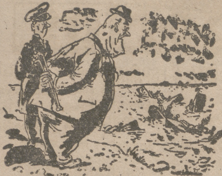
COMPROBACION Roosevelt.—¿Y ésta es nuestra flota de superficie?

Y así pasan los días y van viendo los pobres niños vagabundos del paraíso soviético!