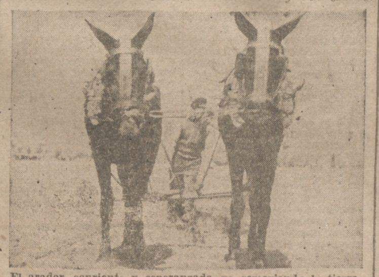
El arador, sonriente y esperanzado, va removiendo la tierra con la ilusión puesta en un futuro prometedor

El total de los cultivos y aprovechamientos nos da la cifra de 44.255.000 hectáreas, lo que puede ser algo más en la realidad, teniendo en cuenta que una misma superficie puede haber sido ocupada en el mismo año agrícola por diferentes cultivos. Sin embargo, ajustándonos a las cifras dadas, resulta que la superficie explotada por los diferentes cultivos y aprovechamientos acusa este porcentaje: