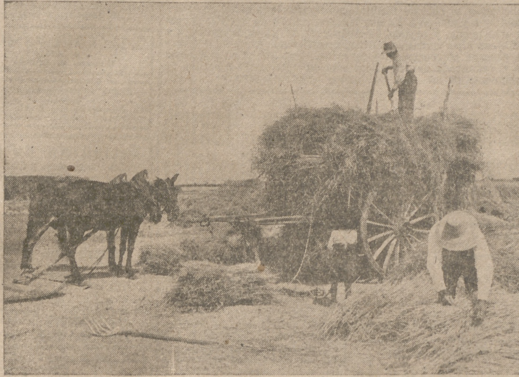
Bajo un sol que abrasa, el sufrido labrador de Castilla recoge la cosecha

Hay en cultivo cuarenta y cuatro millones de hectáreas