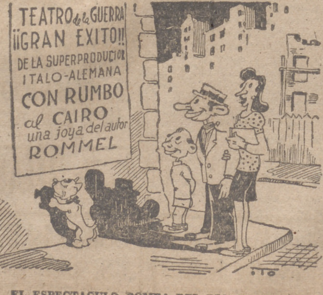
EL ESPECTACULO BOMBA DEL DIA, Por ITO

Los triunfos de Rommel están revolucionando el panorama de la guerra. Los que gustan de anticiparse a los acontecimientos, se imaginan, pues, el desfile por el Rhin de pequeños barcos petroleros cargados con el producto de los yacimientos del Irak. Se ha hablado mucho del petróleo, ruso. Las cosas marchan siempre de manera tan paradójica que puede darse perfectamente el caso de que veamos funcionar los motores de la Luftwaffe con petróleo persa antes de que con petróleo ruso. Lo que ahora parece una fantasía puede convertirse en el curso de este año en un hecho real. Y hay que reconocer que el día que los motores de Europa funcionen impulsados por el petróleo del Irak o del Cáucaso, entonces habrán terminado todas las ilusiones que los ingleses no perdieron aún con respecto al triunfo de su causa, debido a los efectos del bloqueo que pronto hará tres años inclinar contra las naciones europeas que no quisieron sumarse a su