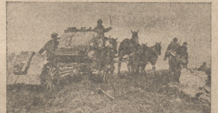
Estas son las carreteras de "primer orden" en la península de Crimea. Un cañón de las fuerzas antiaéreas es llevado con ayuda de tades en su avance