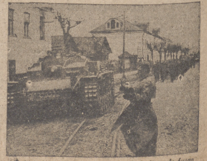
Estantería de tanques en avanca hacia la línea de fuego