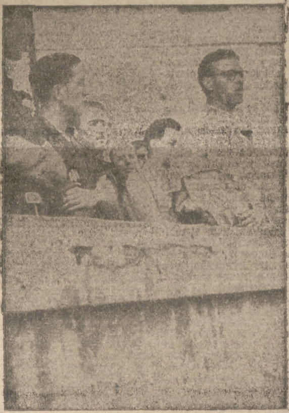
Tarea de formación religiosa en los Albergues Universitarios del S. E. U.