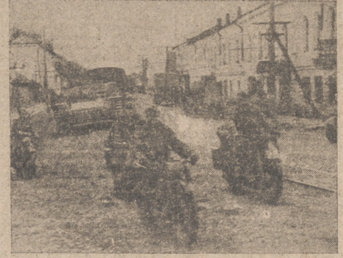
NEUVOS REFUERZOS PARA EL ESTE. — En las carreteras se desarrolla un tráfico muy vivo