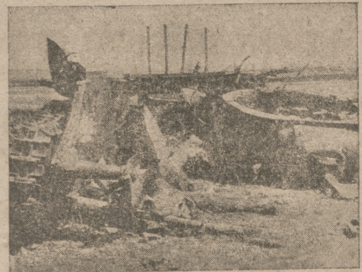
Un tanque soviético destruido por los alemanes. La torre fue arrancada totalmente por la bala de cañón

Gran Cuartel General del FÜHRER, 20. — Comunicado del Alto Mando de las fuerzas armadas alemanas: «Frente a Sebastopol ha prosseguido el aniquilamiento de los restos de fuerzas enemigas que se encuentran aún al Norte de la bahía de Sevastopol. Ha sido conquistado un reducito de artillería y el terreno que rodea a un dique. Continúan los combates por la posesión del último fuerte de la costa, en la parte septentrional de la fortaleza que se sostiene todavía. En el sector Sur del frente de cerco las tropas alemanas y rumanas, después de rechazar los contraataques enemigos, han continuado avanzando y han conquistado al asalto varias colinas fortificadas. El arma aérea ha continuado la destrucción de la fortaleza con bombas de los calibres más pesados. Una lancha rápida alemana hundió anoche, frente a Sebastopol, a un transportador de tropas de 3.000 toneladas. En el mar Negro las lanchas rápidas italia-