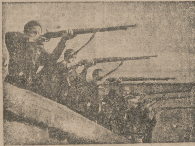
5. De la Delegación Provincial de Combatientes. 6. De la Delegación Provincial de Cadetes. 7. De la VII Región de Milicias. 8. De la Representación de Tiro Nacional. 9. De la Emisora F. E. T. número 11, Radio-Falange. 10. De la Delegación Provincial de la Sección Femenina. 11. De Auxilio Social. 12. Del Sindicato Español Universitario.