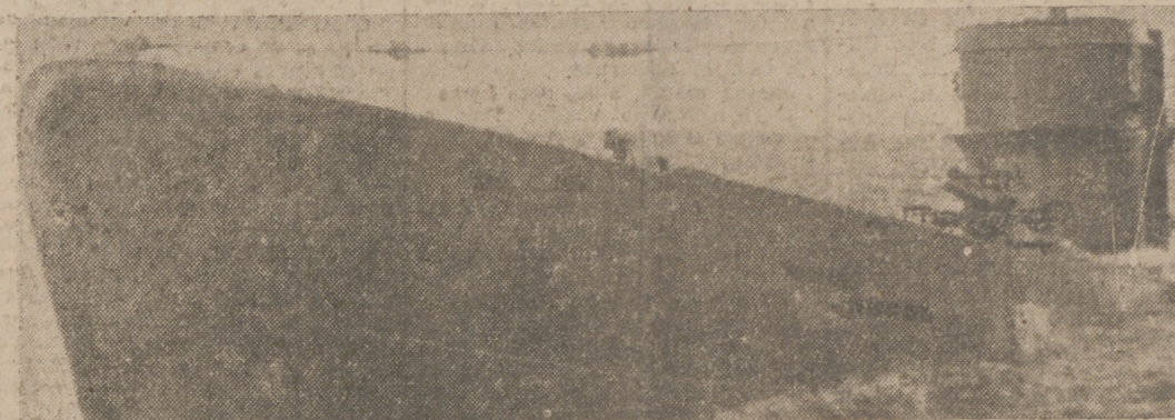
Un submarino alemán sale a la superficie.