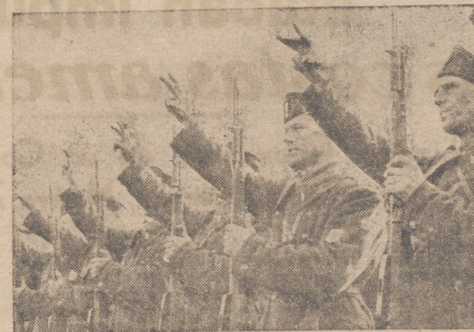
Una legión croata que se incorpora al ejército italiano, presta juramento en una localidad del Norte de Italia, en presencia del jefe de las fuerzas armadas de Croacia, mariscal Kvaternik, y del general Cavallero, jefe del Estado Mayor italiano.—(Foto Cifra).

Roma, 27.—Los centros competentes dan cuenta de que, según un informe sobre los resultados obtenidos por la aviación italiana en los 21 meses de guerra, fueron derribados 2.310 aviones enemigos. La verdadera cifra de aparatos destruidos es seguramente mucho más alta, ya que sólo han sido computados aquellos aparatos cuya destrucción puede comprobarse sin género de dudas.—Efe.