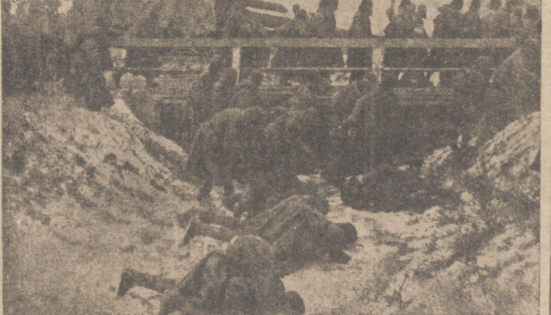
Días enteros estuvieron sin recibir alimentos estos soldados soviéticos. Ahora, durante la primera hora de su equisitorio, se lanzan sobre un arroyo helado, abren agujeros en el hielo y haban beber.

ta Oficial" publica un decreto en el que se hace saber que el "estado de urgencia" ha sido extendido al conjunto del territorio septentrional del continente australiano, donde se encuentra Puerto Darwin.—Efe.