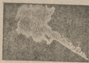
En un ataque del arma aérea alemana a la base naval rusa de Kronstadt, los "Stukas" echaron a pique un torpedero soviético. La foto muestra al buque ardiendo

En los demás sectores del frente Este las tropas alemanas (Pasa a la tercera página).