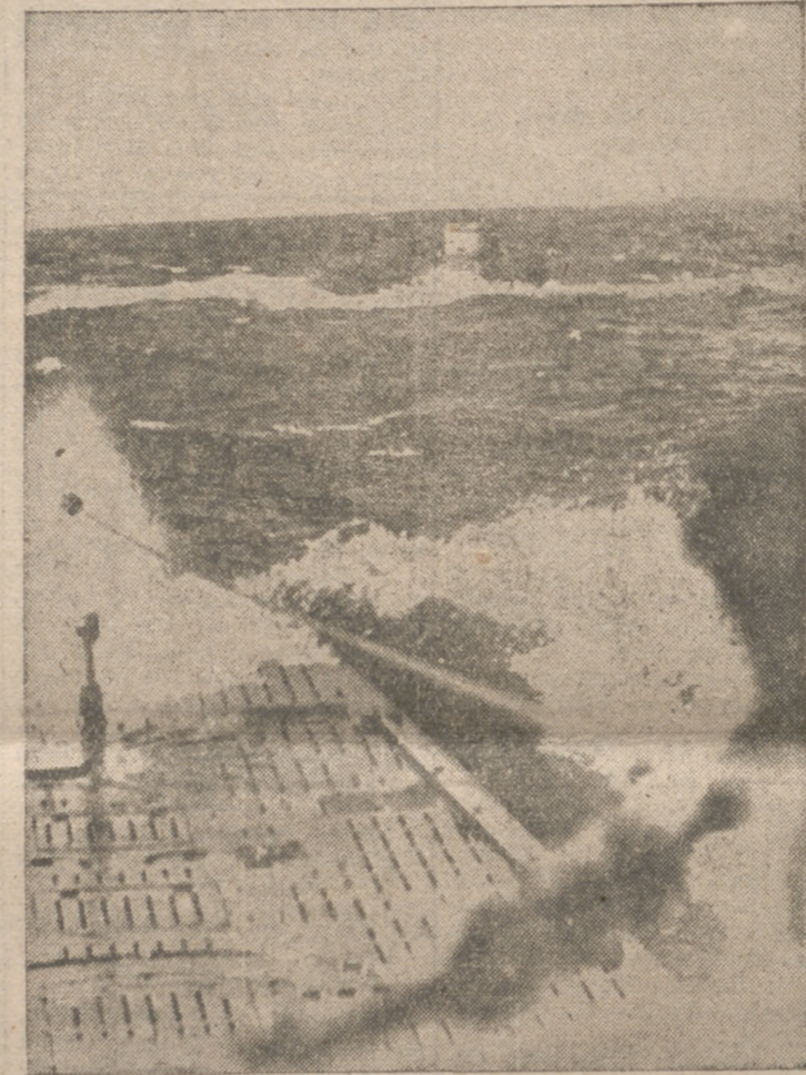
Dos submarinos alemanes en el Atlántico, donde éstos ganan otra de las grandes batallas de esta guerra para Alemania

Otra incursión contra los objetivos japoneses en Birmania ha sido efectuada con éxito por los aviones del grupo de voluntarios norteamericanos. Los pilotos estadounidenses atacaron el aeródromo ocupado por los japoneses en Mulmein, durante la tarde de ayer, incendiando cinco aviones enemigos y ametrallando a otros aparatos que se encontraban en tierra.—Efe.