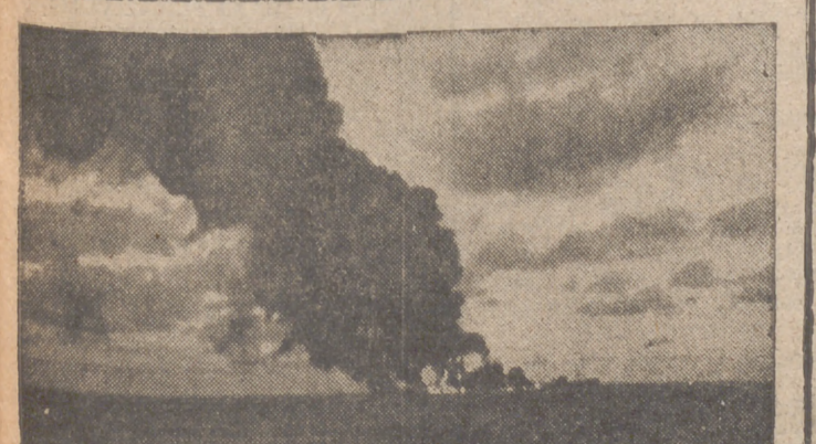
Petrero enemigo hundido por un submarino alemán ante la costa de los Estados Unidos

Roma, 19.—La «Gaceta Oficial» publica un comunicado de la Presidencia del Consejo de ministros, en el que se anuncia que el príncipe Amón de Saboya Aosta, duque de Spoleto, ha tomado el título de duque de Aosta a consecuencia de la muerte del príncipe Amadeo de Saboya Aosta, último duque de Aosta, sin dejar descendencia masculina.—Efe.