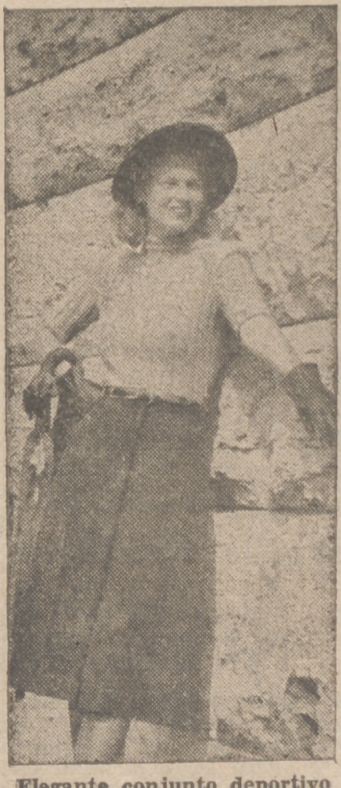
Elegante conjunto deportivo vienés.