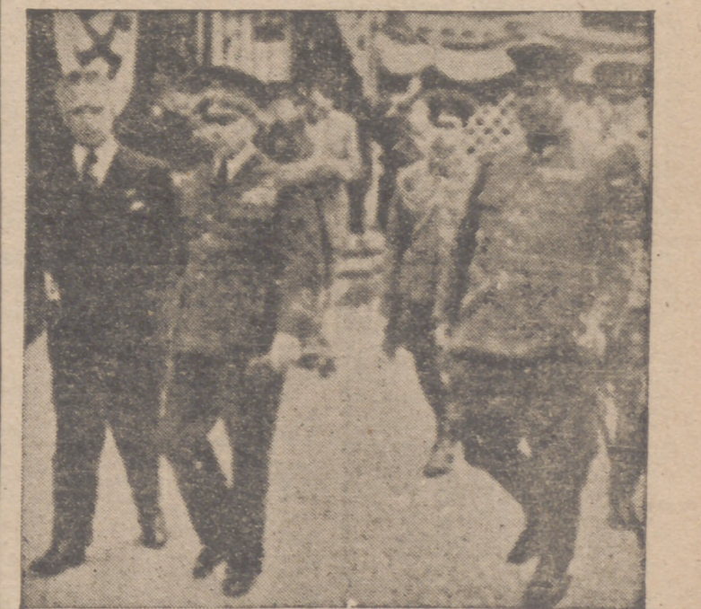
El general Tomimichi, conquistador de Singapur, durante la visita que hizo a Milán con la Misión de técnicos japoneses.

La fusión de Falange Española y las J. O. N-S. no fué la unión de dos partidos políticos más, sino la puesta en marcha de un movimiento de trascendencia nacional, juvenil y revolucionaria.