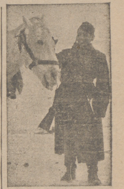
Un corneta valenciano de la División Azul

La fusión de Falange Española y las J. O. N-S. no fué la unión de dos partidos políticos más, sino la puesta en marcha de un movimiento de trascendencia nacional, juvenil y revolucionaria.