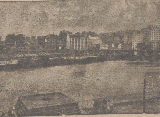
El río Yarra a su paso por Melbourne