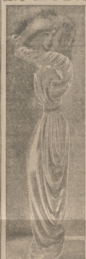
Traje de noche de crepe satin a base de fibras artificiales