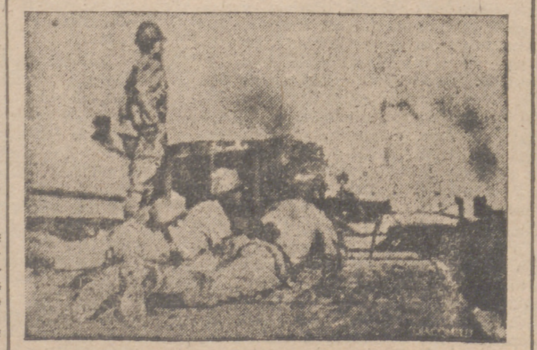
Una patrulla enemiga ametrallando, desde el techo de un roñón, las tropas inglesas

El señor Ruiz Jarabo y las jerarquías sindicales mencionadas cambiaron igualmente impresiones sobre los problemas relativos a abastecimiento de los productores.