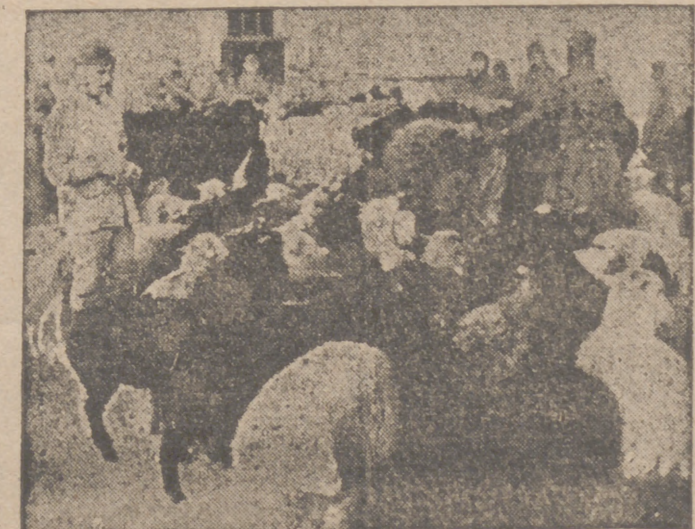
Soldados de una compañía de abastecimiento del Ejército alemán en el frente del Este

Tokio, 10.—La Cámara de los Pares ha aprobado por unanimidad el presupuesto del ejercicio 1942-43 que se eleva a 8.608 millones de yens, y los créditos suplementarios para el mismo ejercicio, que importan 3.463 millones de yens.—Efe.