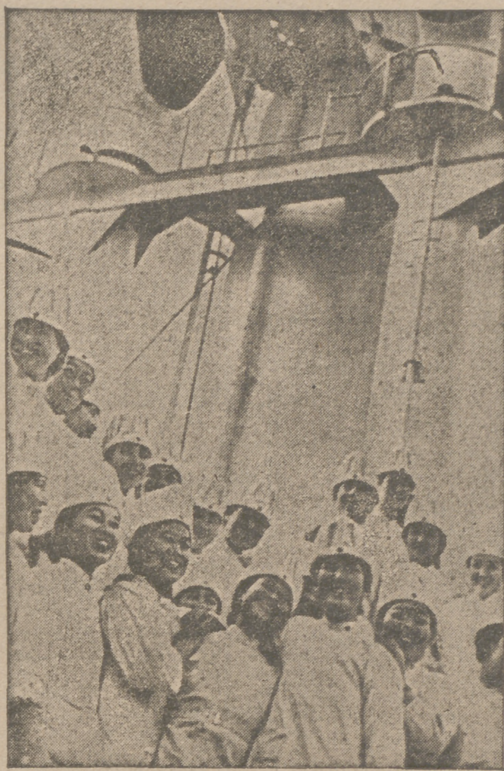
Toda la nación japonesa colabora en la guerra. Mujeres de la Cruz Roja nipona que hacen su servicio en el mar chino meridional

Refiere el caso de un estudiante ruso de Medicina, que volvió a la ametralladora contra los suyos y se pasó a las filas de la División Azul. Cifra.