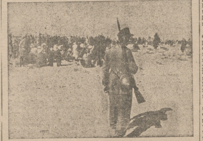
Campo de concentración de prisioneros británicos en el frente del Africa del Norte

mente la 25 División de Infantería motorizada Wurtemberguesa y la Legión flamenca, que opusieron tenaz resistencia, que opusieron tenaz resistencia, coronada por el éxito, a los ataques en masa del enemigo, realizados con extraordinaria violencia. Como ya se ha informado en un comunicado especial, los submarinos alemanes han hundido en el Atlántico ocho mercantes que desplazaban un total de 50.500 toneladas, así como una corbeta. Otro buque de tonelaje importante fué gravemente averiado por un torpedo. Seis de los buques en cuestión, con un total de 34.500 toneladas, fueron hundidos frente a las costas norteamericanas.