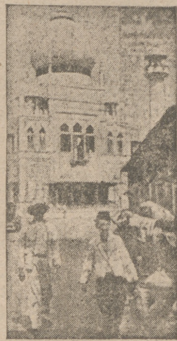
Una calle de Singapur

Decoración, modas, labores, literatura, arte, secretos útiles, en la revista más femenina e interesante, "Y". Puedes adquirirla en cualquier quiosco de la capital.