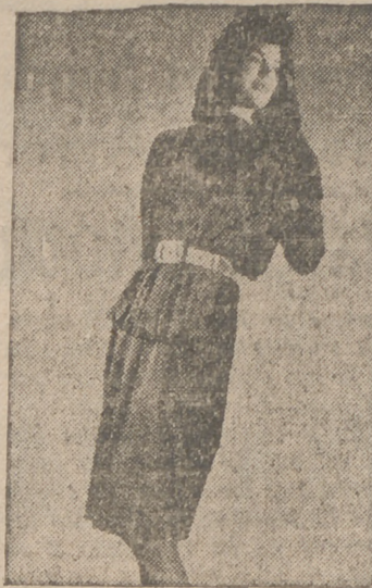
La moda.—Un vestido de tarde marroquí, color marrón, sin escote, con delantalito fruncido y falda lisa.

La batería en aluminio, en níquel, en esmalte, en cobre, ya no es el esfuerzo muscular requerido por las cocinas pesadas de otros tiempos. Una manita de trapo, rápidamente desmenuada, bastará para limpiar las paredes encucadas de azulejos, los hornos, los platos y los días son fácilmente brillantes. Para no ser ama de casa la perfección de los materiales lo que ha servido para es ableser lo que se llama la verdadera cocina moderna, que hace del arte culinario una acción agradable y primordial, digna de las mayores atenciones. El modo inteligente con que se disponen los utensilios necesarios al condimento de las viandas permite ahora no perder tiempo en la preparación de las mismas.