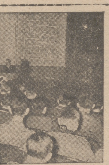
Acaba de inaugurarse en Berlín el primer teatro de televisión, que en adelante abrirá sus puertas diariamente para soldados y heridos

AL DARLE SEPULTURA: "Aquí tenemos, ya en tierra, a uno de nuestros mejores camaradas. Nos da la lección magnífica de su silencio. Otros, cómodamente, nos aconsejarán desde sus casas ser más animosos, más combativos, más duros en las represalias. Es muy fácil aconsejar. Pero Matías Montero no aconsejó ni habló: se limitó a salir a la calle a cumplir con su deber, aun sabiendo que probablemente en la calle le aguardaba la muerte. Lo sabía porque se lo tenían anunciado. Poco antes de morir dijo: "Sé que estoy amenazado de muerte, pero no importa si es para bien de España y de la causa". No pasó mucho tiempo sin que una bala le diera cabalmente en el corazón, donde se arislaban su amor a España y su amor a