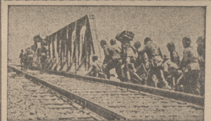
Soldados japoneses con carga de dinamita para volar un puente entre Tailandia y Birmania

"Aquí tenemos, ya en tierra, a uno de nuestros mejores camaradas. Nos da la lección magnífica de su silencio. Otros, cómodamente, nos aconsejarán desde sus casas ser más animosos, más combativos, más duros en las represalias. Es muy fácil aconsejar. Pero Matías Montero no aconsejó ni habló: se limitó a salir a la calle a cumplir con su deber, aun sabiendo que probablemente en la calle le aguardaba la muerte. Lo sabía porque se lo tenían anunciado. Poco antes de morir dijo: "Sé que estoy amenazado de muerte, pero no importa si es para bien de España y de la causa". No pasó mucho tiempo sin que una bala le diera cabalmente en el corazón, donde se arislaban su amor a España y su amor a