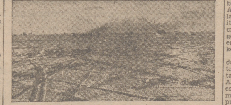
Las huellas de una batalla en el desierto de Africa del Norte, donde las fuerzas del Eje obtienen nuevos y brillantes éxitos

A las 23,30 horas el mariscal del Reich abandonó Roma en tren especial, que salió de la estación de Ostia, con destino a Alemania. El Duce estaba en la estación para despedir personalmente al mariscal Goering. Después de haber presenciado ambas personalidades el desfile de las formaciones de honor, el Duce se despidió cordialmente de Goering, al que expresó con cálidas palabras la unión sincera que existe entre las dos potencias del Eje. Estuvieron también presentes en la estación el conde Ciano, el general Cavallero, el secretario de Estado, Fougier, y los generales Ricciardi y Gambera; este último transmitió a Goering el saludo de Su Alteza Real el príncipe heredero Humberto. Además se despidieron a despedir al mariscal del Reich el general feldmariscal Kesserring y el embajador alemán, von Mackensen.—Efe.