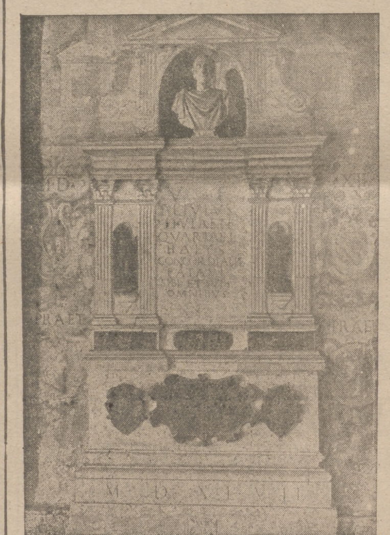
Monumento erigido en memoria de Tito Livio con ocasión de celebrarse en Italia su segundo milenario

"Sólo existe una Nación cuando tiene un Jefe, un Ejército que la guarda y un pueblo que la asiste." (Palabras de Franco en el Monasterio de Monserrat.)