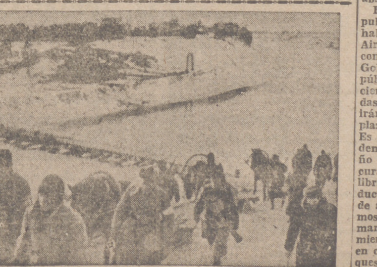
Trozas del Eje camina del frente ruso

Río de Janeiro, 10.—El periódico "El Comercio" publica una información procedente de Quito, según la cual El Ecuador someterá a examen en la Conferencia de Río de Janeiro el litigio territorial pendiente con El Perú.—Efe.