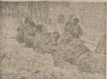
Cañones alemanes en acción en el sector central del frente ruso