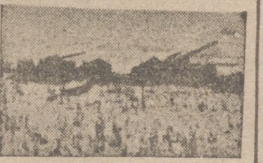
Una avanzadilla italiana en Rusia

Las 171.000 toneladas recientemente adquiridas vendrán a España distribuidas en cuatro meses.