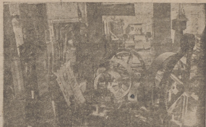
Primera Feria de Muestras de Cracovia (antigua Polonia) inaugurada por el gobernador general, ministro del Reich doctor Frank, y que da por primera vez una idea de las posibilidades económicas e industriales del distrito de Cracovia

Fuertes destacamentos de Policía habían sido movilizadas para mantener el orden; pero los manifestantes se disolvieron pacíficamente después de desfilarse por las calles céntricas.—Efe.