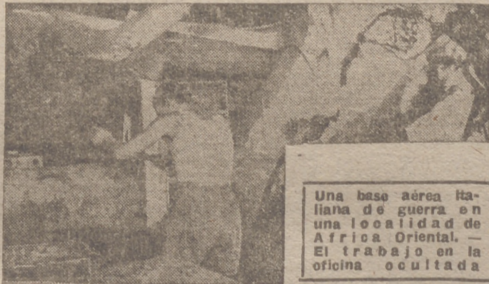
Una base aérea italiana de guerra en una localidad de Africa Oriental. — El trabajo en la oficina ocultada

Madrid, 23.—El general Millán Astray, acompañado de su familia, distribuyó esta mañana aguinaldos, consistentes en viveres, entre las familias más necesitadas del barrio de Doña Carlota, uno de los más humildes de la capital. Al entrar en una de las casas, como viera al jefe de la familia que la habitaba tirando de frío, le regaló el abrigo que él mismo llevaba puesto. —Cifra.