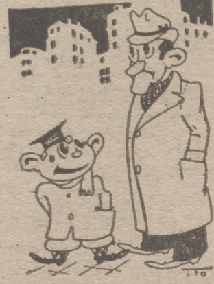
"CHINITO" SIN SU ABUELO