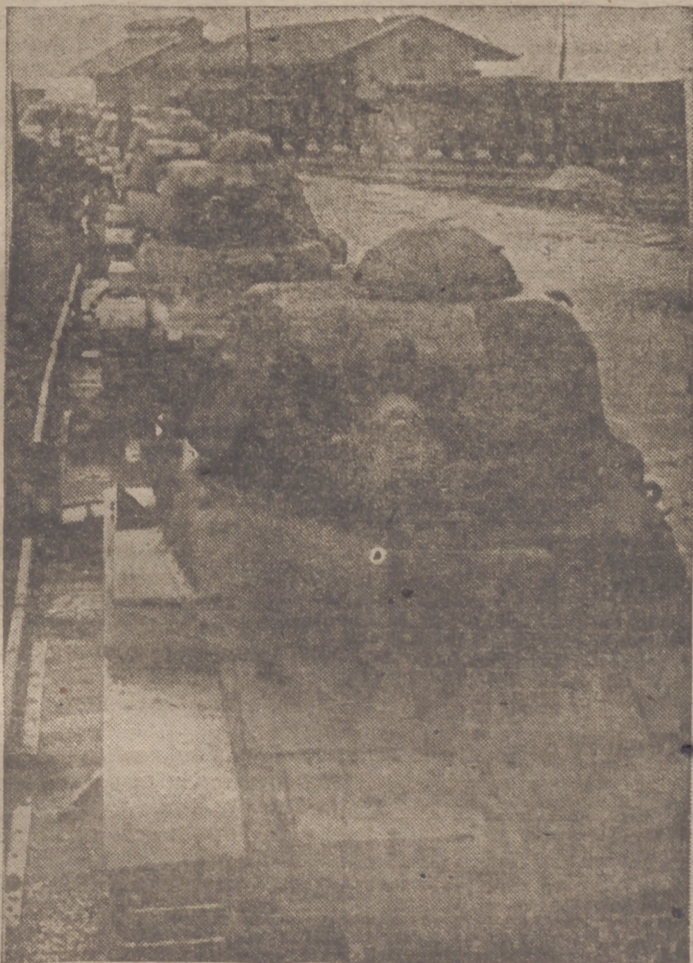
Tanques alemanes son transportados por ferrocarril a puntos de importancia estratégica