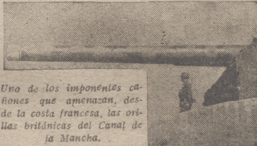
Una de las imponentes cañones que amenazan, desde la costa francesa, las orillas británicas del Canal de la Mancha.