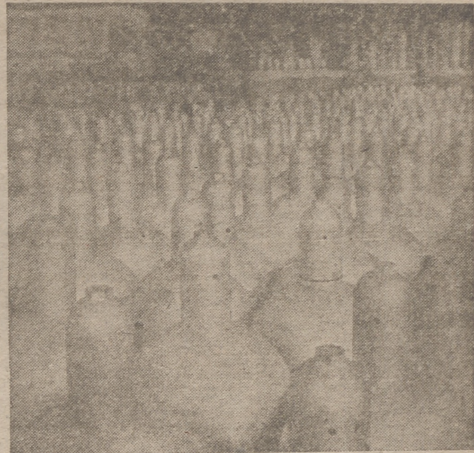
Las fábricas de Lenna, el corazón de la industria de guerra de carburantes de Alemania.

Munich, 27.—El Führer ha visitado en Munich al tesorero general del Partido Nacional-socialista, Schwarz, para felicitarle personalmente con motivo de su 65 aniversario.—Efe.