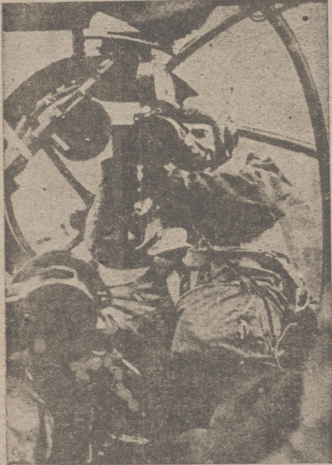
Un operador cinematográfico de las compañías de propaganda del Reich, actuando a bordo de un avión