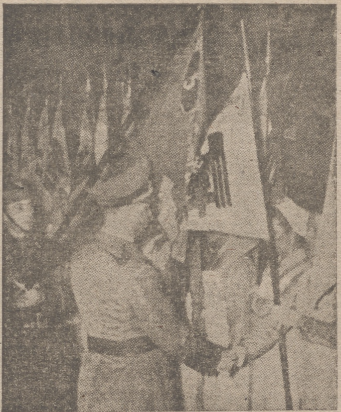
Enfermeras alemanas reciben los estandartes de sus grupos y prestan juramento a la bandera de combate de los mártires de Horst Wessel.

Llegan constantemente quejas a este Departamento que muchos industriales panaderos dejan de suministrar pan a los pueblos que habitualmente lo venían haciendo, por manifestar unos que con la reducción de los cupos no tienen bastante y otros por haberles dado orden el señor alcalde de no llevar pan a los pueblos que surtan. Inexorablemente seguirán los panaderos llevando pan a los pueblos que habitualmente suministraban, entendiéndose que la reducción de cupos no impide seguir cumpliendo esta orden, puesto que esta restricción ha de ser igual para todos, teniendo bien entendido que al que no lo cumpla le retiraré el cupo y se le dará a otro industrial, sin perjuicio de imponer la sanción que proceda. Espero que los señores alcaldes cumplan y vigilen esta orden. Valladolid, 27 de noviembre de 1940.—El gobernador civil.