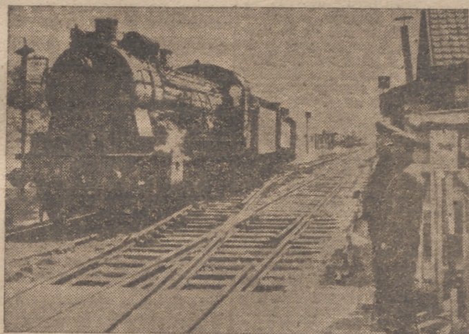
Un tren a París.—Los empleados de los ferrocarriles alemanes se han hecho cargo del servicio de la parte ocupada de Francia y desempeñan sus funciones con la misma exactitud y seguridad como en Alemania

Roma, 7.—El «Popolo di Roma» dice que el Gobierno de Vichy trata, por medio de reformas interiores y de procesos contra los responsables merecer gracia de Alemania. Son vanas ilusiones—dice el diario—. Incluso cuando Francia haya adoptado un orden corporativo y haya condenado a determinados dirigentes de la poli-