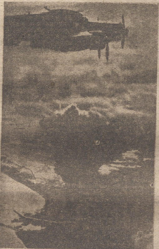
La aviación italiana realiza diariamente fuertes bombardeos a los objetivos militares de la isla de Malta. He aquí una fotografía tomada en uno de los últimos ataques a la posesión inglesa