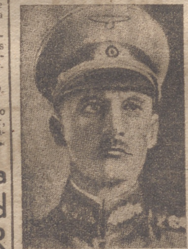
El mariscal de campo alemán Lech

para de los Comunes, y en relación con una pregunta sobre las relaciones anglo-soviéticas, lo siguiente: «Lord Halifax ha enviado recientemente instrucciones al embajador en Moscú para que es-