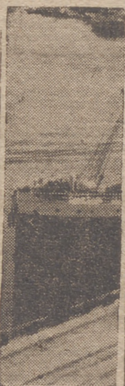
La guerra en Africa y en el Mediterráneo ha paralizado el tráfico por Suez

gos artículos a la actitud británica respecto de la Transilvania. Los periódicos más allegados a los círculos gubernamentales, como el "Uj Magyarasag", comentan que Inglaterra ha demostrado claramente con su actitud actual que ella no ha abandonado—dice el periódico—el espíritu de Versalles. «Todo lo que se ha escrito en Inglaterra—continúa el diario—en favor de una revisión del Tratado de Versalles ha sido olvidado ya. La actitud británica respecto del Sudeste europeo está inspirada exclusivamente por el odio inglés hacia Alemania y el Eje, cuyo fin es crear en el Sudeste de Europa las condiciones necesarias para una paz sólida y equitativa». —Efe.