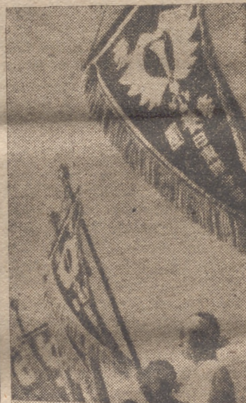
Estandartes de las organizaciones antibritánicas en una concentración de Kioto

Algeciras, 7.—Los aviones ingleses realizan ahora diariamente ejercicios de vigilancia sobre el arsenal de Gibraltar y las fortificaciones de la plaza inglesa, volando a poca altura, con el consiguiente sobresalto de la población civil.—Cifra.