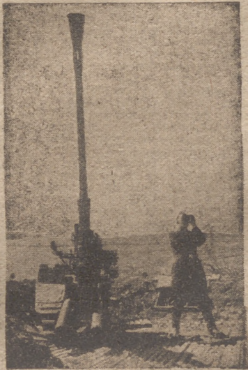
Defensas antiáreas en el Canal de la Mancha.

Sudeste. Esta concepción fué el espectro que espantaba a los espíritus temerosos; fué también la esperanza de los intrigantes y un elemento esencial de la política