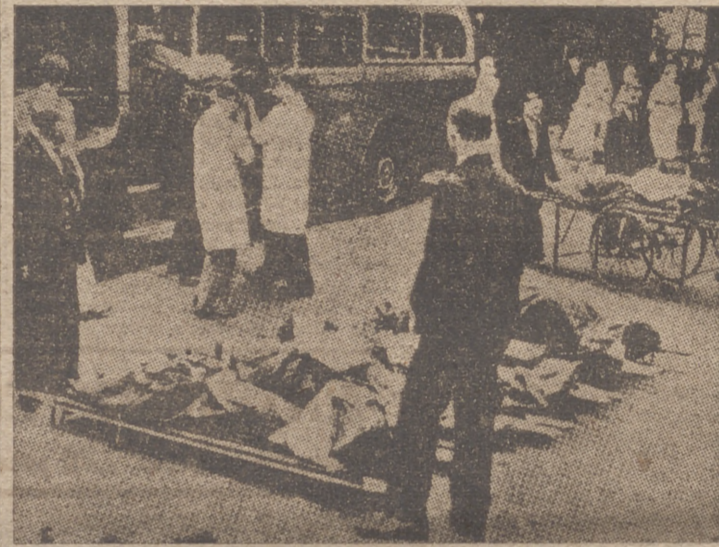
Evacuación de un hospital de Sunderland hacia el interior de la isla.

Como españoles, hermanos de las tres cuartas partes de los habitantes de América, nos duele que muchos Gobiernos de los pueblos hispánicos se dejen embaucar por el imperio de la banana. América vive sujeta a la hegemonía de la Casa Blanca, mayor amenaza que ese peligro tan lejano que manejan, a menos que exista una mentalidad capaz de creer seriamente que la guerra puede decidirse en la Guayana inglesa o en Belize.