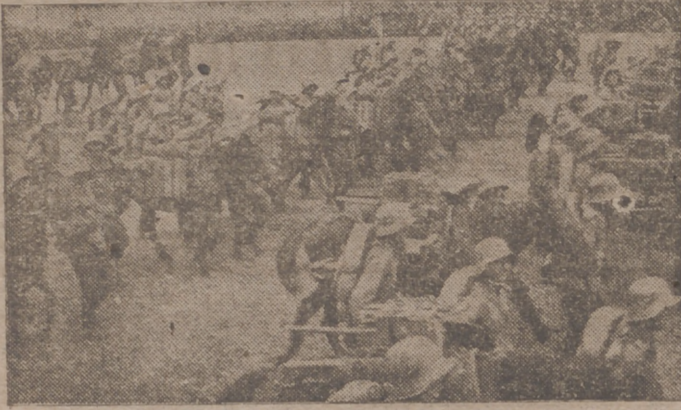
Una agrupación de artillería de montaña alemana a la entrada de uno de los pueblos próximos a París