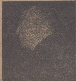
BULLITT, embajador de los Estados Unidos, a quien se encargó de la entrega de París