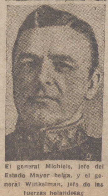
El general Michiels, jefe del Estado Mayor belga, y el general Winkelman, jefe de las fuerzas holandesas