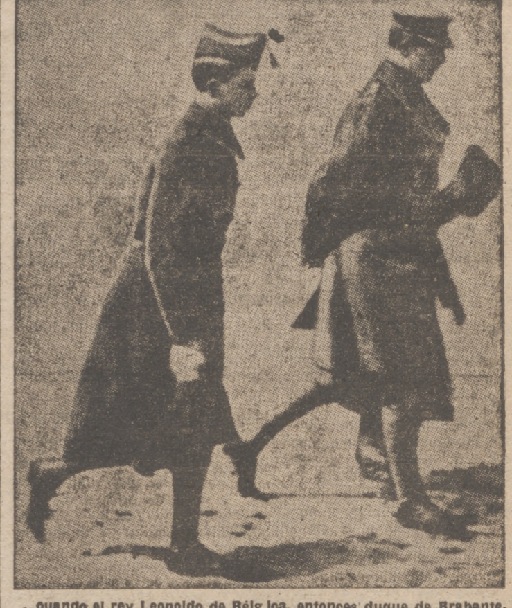
...cuando el rey Leopoldo de Bélgica, entonces duque de Brabante, acompañaba en la guerra al rey Alberto