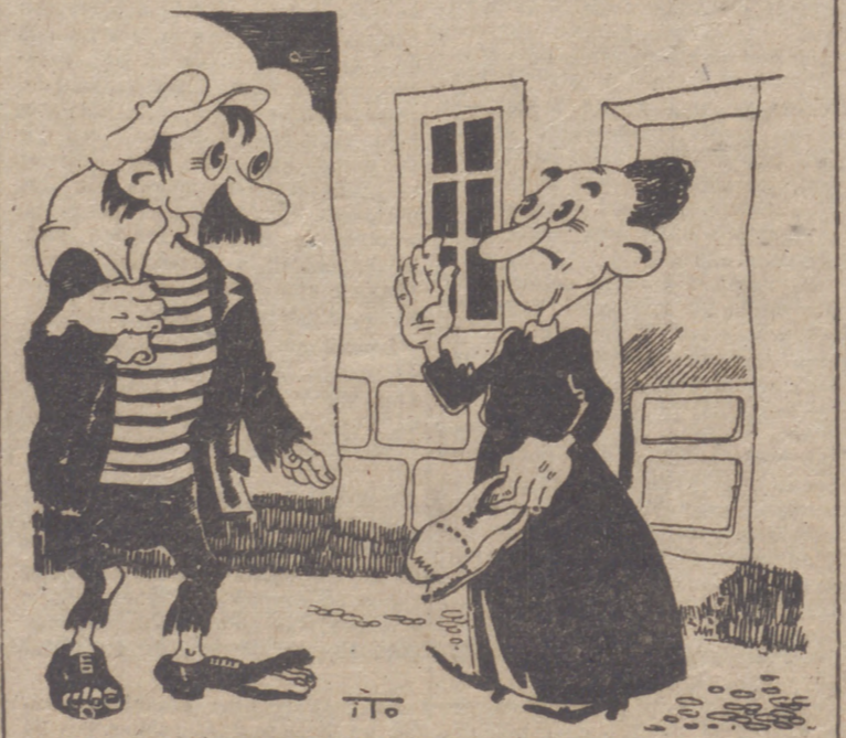
LA MODA EN LOS ZAPATOS (Por ITO)

Londres, 13.—Según anuncia un comunicado del Ministerio del Aire han participado por primera vez en un combate aéreo los nuevos aviones de caza británicos Paul Boulton, tipo "Defiant". Este primer combate, desarrollado sobre la costa holandesa, no duró más de cinco minutos, suficientes para derribar en un campo al sur de La Haya, a un "Junkers 88", que intentaba bombardear a tres buques ingleses. Estos nuevos aviones de caza están provistos de una torreta de control eléctrico. Se anuncia además que un "Spitfire" que acompañaba a los nuevos "Defiant" derribó a un "Heinkel 111" que, como el "Junkers", intentaba bombardear a los navios británicos.—Efe.