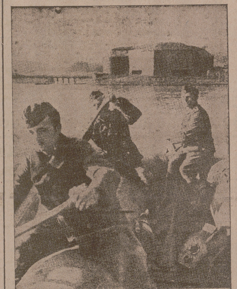
Soldados alemanes en una embarcación cerca de la línea Sigfrido.

ALMURZO EN LA EMBAJADA ALEMANA Madrid, 18.—En la Embajada alemana se ha celebrado un almuerzo con asistencia del ministro de Marina y señora; del ministro sin cartera, Sánchez Mazas y señora, y del consejero nacional camarada Giménez Arnau y otras personalidades. Cifra.