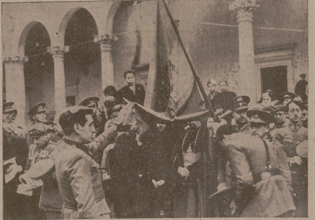
Un momento de la jura de los 92 supervivientes de la XVII promoción. El general Muñoz Grande sostiene la enseña nacional.

El general Moscardó regresó a Madrid al terminar los actos del Alcázar. Los supervivientes de la XVII promoción se dirigieron por la tarde al café Español, al igual que lo hacían hace 29 años en sus tiempos de cadetes. A las seis menos cuarto salió de Toledo el tren especial de regreso para Madrid.—Cifra.