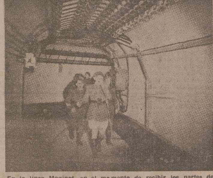
En la línea Maginot, en el momento de recibir los partes de los puestos avanzados

Tenemos nuestra voluntad y nuestra fuerza hacia el futuro, animados por el recuerdo de lo que ha sido ya realizado".—Efe.