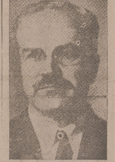
MOLOTOV, jefe de la política exterior de Rusia, y del que se esperan los gestos definitivos

HOMENAJE A LA HEROINA DEL SITIO DE ZARAGOZA Zaragoza, 4.—Con motivo de cumplirse mañana el aniversario de la heroína del sitio de Zaragoza y fundadora de las Hermanas de la Caridad de Santa Ana, la Diputación ha organizado una solemne función religiosa.—Cifra.