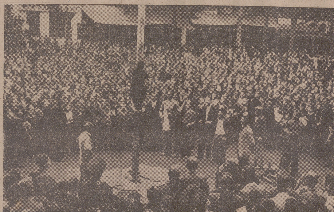
Un momento de las "cucanas" celebradas en el Campo Grande

Cuantas personas asistan al acto, excepción de las que por su cargo formen parte de la comitiva, se hallarán en el teatro con antelación. Los terminados el acto, nadie deberá abandonar sus asientos, esperando para efectuarlo que las autoridades abandonen el local, facilitando de este modo el homenaje de respeto y adhesión que en aquel instante ha de tribu-társela.