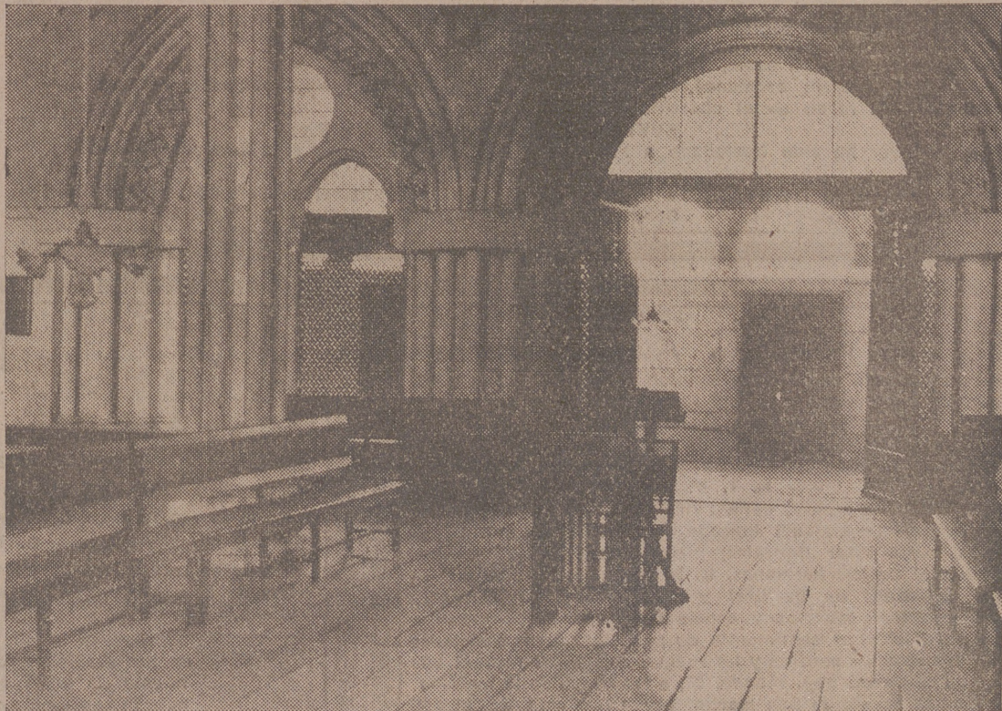
BURGOS.—El próximo día 26 se celebrará en el histórico Monasterio de las Huelgas el juramento, ante el Caudillo, del nuevo Consejo Nacional de Falange Española Tradicionalista y de las J. O. N. S. Sala capitular del Monasterio de las Huelgas, en la que el Caudillo recibirá el juramento de los nuevos consejeros nacionales

Al acto, organizado por la Asociación de supervivientes de dicha galería, asistieron los familiares de las víctimas, jerarquías del Movimiento y mucho público.—LOGOS.