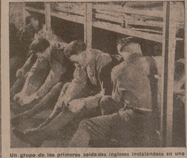
Un grupo de los primeros soldados ingleses instalándose en uno de los abrigos de las fortificaciones francesas

montañosos, seguramente con la intención de poder abovar todo movimiento ofensivo en cualquier dirección y de mantener seguras las salidas. Hasta ahora solamente en la región central y Norte se han decidido a descender al llano: en el Sur siguen el camino de la montaña, más difícil y peligroso, pero también más seguro y de mayores consecuencias. Y mientras esto sucede en los sectores de la Galitzia, en el centro continúa la liquidación de la gran batalla de Varsovia, en la que, ciertamente, los alemanes saben conducirse y adoptan una posición defensiva para destruir los núcleos organizados que aún pueda oponerles el mando bolaco. Siempre fué una inteligente medida asegurarse unos contraataques de los que se puede sacar más éxito que de cualquier operación ofensiva. No solamente la guerra tiende hacia la conquista, sino que también necesita anular los recursos militares, y este es un procedimiento. Pero las operaciones de la Galitzia no solamente ponen a los alemanes en posesión de abanos militares, sino que también les aseguran el dominio de los centros industriales: en el mismo Lemberg—la tercera población de Polonia—existen refineries de petróleo e importantes fábricas de material de guerra y pólvora. Y todo esto, el haber logrado todos estos objetivos reunidos, es un éxito que merece tenerse en cuenta y que muy pronto se dejará sentir. C. R.