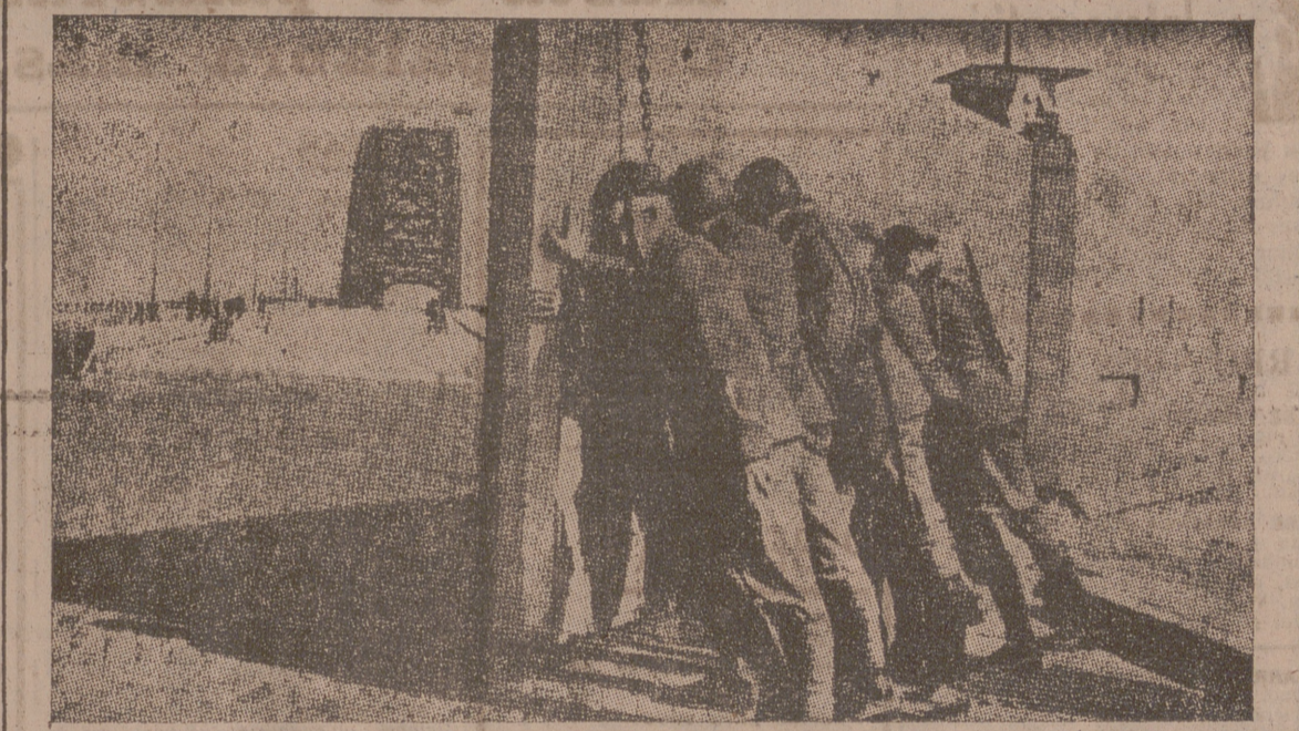
El pueblo bucólico de los molinos de viento ha tenido que adoptar grandes medidas militares. Los soldados holandeses cierran el puente de la frontera con puertas de hierro.