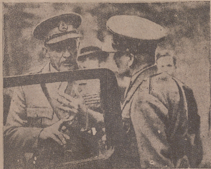
El general Ironside, jefe del Estado Mayor británico, llega a Downing Street, donde conferenciará con Chamberlain sobre la situación internacional