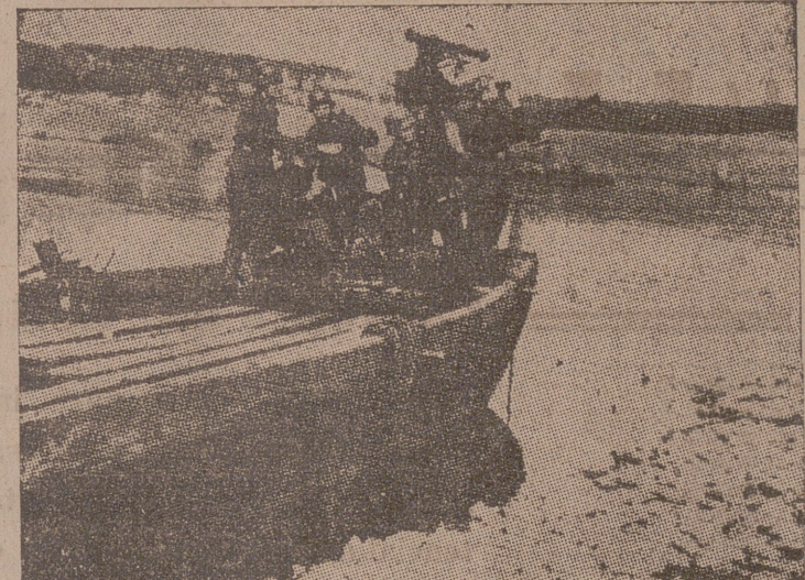
Las fuerzas alemanas han atravesado el Vistula y lo defienden ya. Sobre una barcaza han instalado un pequeño cañón anti-aéreo