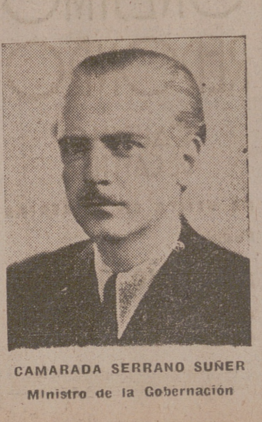
CAMARADA SERRANO SUÑER Ministro de la Gobernación