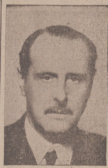
DON ESTEBAN BILBAO Ministro de Justicia