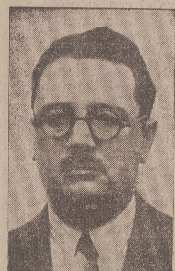
DON JOSE LARRAZ LOPEZ Ministro de Hacienda