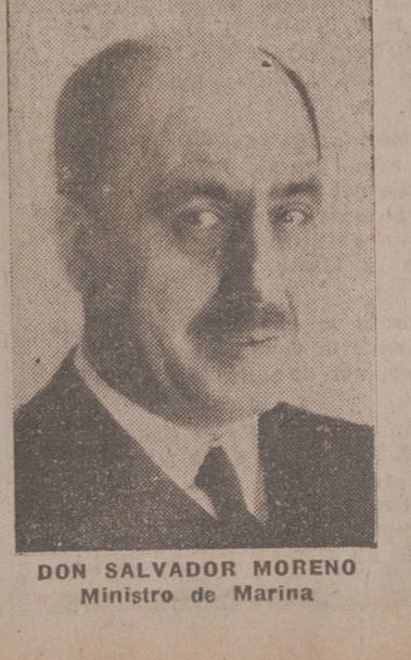
DON SALVADOR MORENO Ministro de Marina