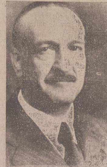
DON ALFONSO PENA BOEUF Ministro de Obras Públicas