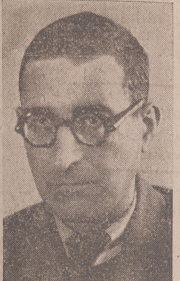
CAMARADA SANCHEZ MAZAS Ministro sin cartera