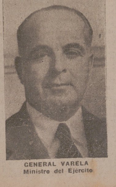
GENERAL VARELA Ministro del Ejército