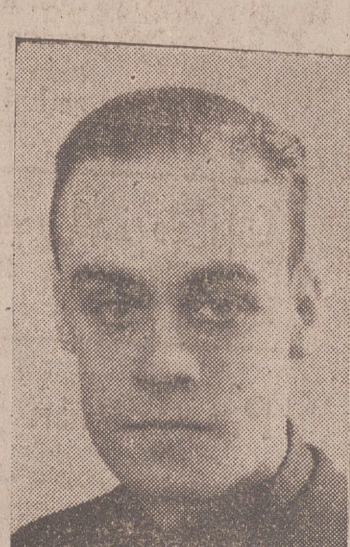
CAMARADA CAMERO DEL CASTILLO Ministro sin cartera