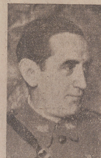
GENERAL MUÑOZ GRANDE Ministro sin cartera