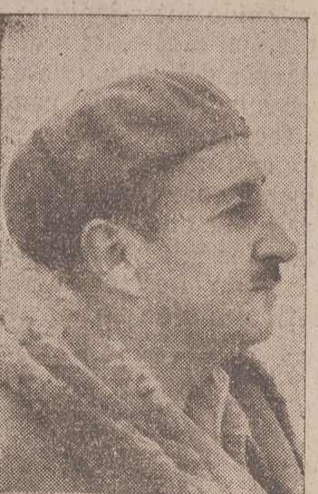
SR. ALARCON DE LASTRA Ministro de Industria y Comercio