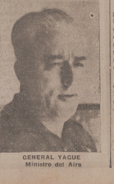
GENERAL YAGUE Ministro del Aire