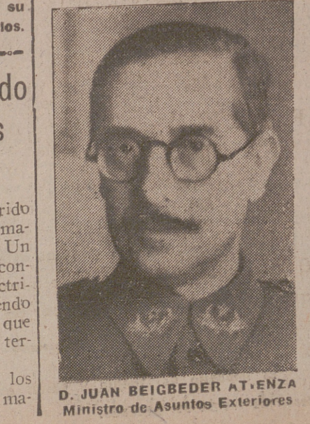
D. JUAN BEIGBEDER ATENZANA Ministro de Asuntos Exteriores