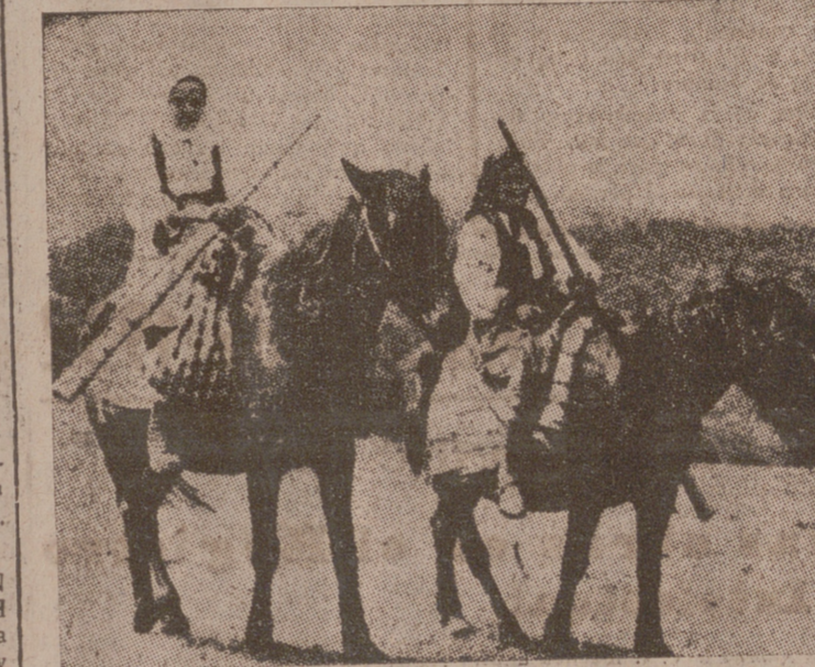
En Transilvania, cada año por agosto, las mujeres campesinas casaderas recorren los pueblos apostando en largos cuernos

Informes: Administrador del Balneario: SOLARES (San) rander