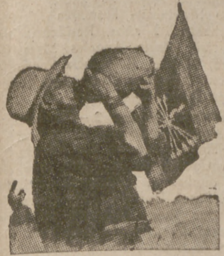
Sudando a chorros, bajo un sol implacable, el segador apaga su sed abrasadora