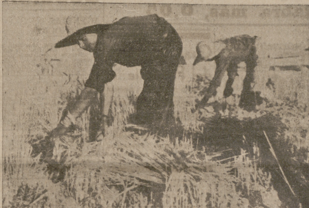
Bajo el sol abrasador y encorvado, de luz a luz, el segador va derribando las doradas espigas de trigo

Bucarest.—A juzgar por un estudio en el anuario rumano de estadística, cuya edición de 1938-39 acaba de salir a la luz pública sobre el territorio rumano, que mide 295.000 kilómetros cuadrados, viven 19,5 millones de personas aproximadamente. En comparación con las cifras del último censo de 1930, se registra un aumento de millón y medio de habitantes. Con respecto a la composición de la población sobre la base de la lengua materna, el censo de 1930 había dado los siguientes resultados, que a falta de posteriores elementos de juicio deben considerarse aún como válidos: Habla el rumano el 73 por 100 de la población; el húngaro, el 8,6 por 100; el alemán, el 4,2 por 100; el ruso y ucraniano, el 3,6 por 100; el búlgaro, el 2 por 100. Como lengua materna se indica también el judío, hablado por el 2,9 por 100 de la población, o sea por 519.500 personas. Sin embargo, el elemento judío en Rumania es mucho más numeroso, ya que en el mismo censo la religión israelita resultó profesada por 780.000 personas. Añadimos a este número los muchos judíos conversos y los militarizados desde 1918, cifra considerable, que seguramente ha elevado el número de judíos de Rumania a más de un millón.