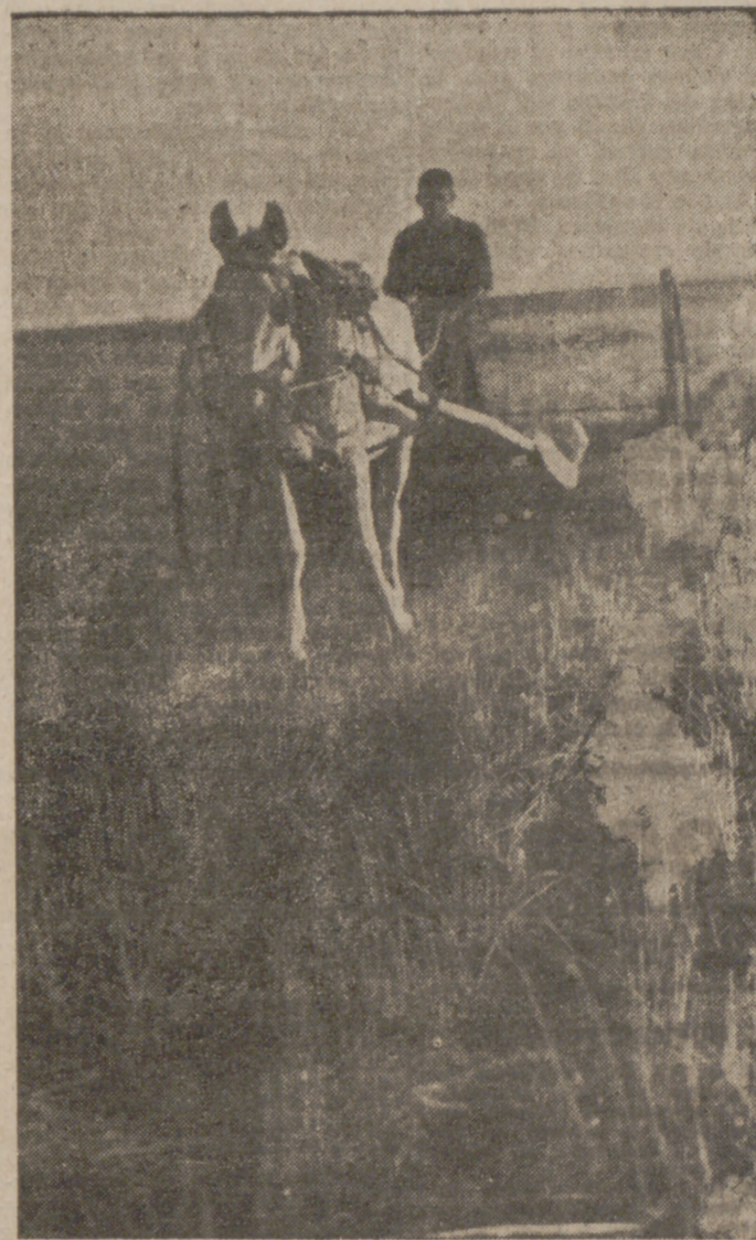
La máquina espigadora recoge las espigas escapadas de la mano del segador

De esta forma la siega rinde muchísimo más y con menos trabajo. Pero estas máquinas son solamente para las grandes labranzas y cotos