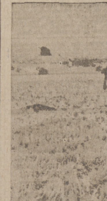
La cuadrilla, atravesando sierras y rastrojos, se encamina al tajo para continuar la tarea

La cuadrilla encorva su cuerpo, se cala el sombrero y cara al surco empezado va derribando granadas es-