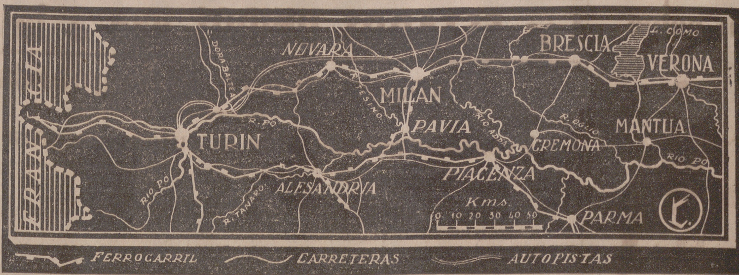
El valle del Po, que ha sido teatro de las operaciones realizadas por el Ejército italiano en la semana pasada.