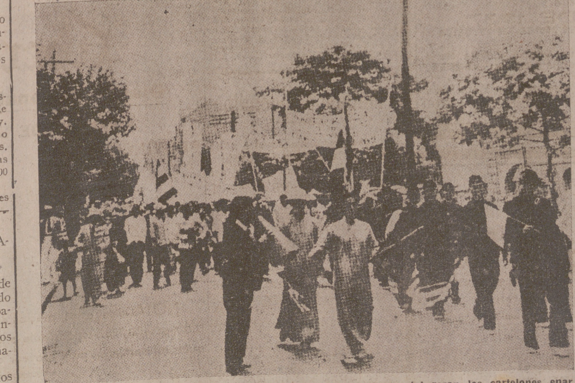
«Si queremos paz en Asia Oriental, hemos de echar a Inglaterra», tal rezan los cartelones enarbolados por estos manifestantes de Tsingtan

El señor Morgentau, que hace el viaje a Europa por primera vez desde la Gran Guerra, se ha negado a hacer declaraciones a la Prensa. Esta tarde saldrá con dirección a Dinamarca.—D. N. B.