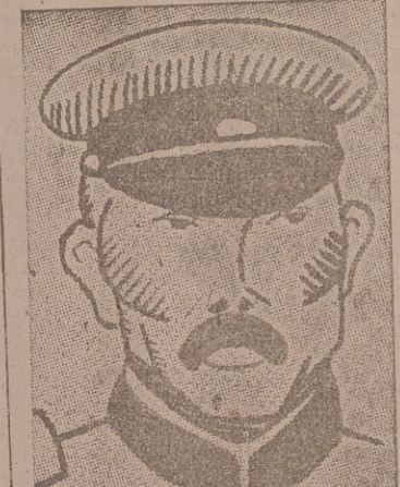
Itagaki, general-jefe del Ejército japonés

En marzo del año actual China recibió de los ingleses un empréstito de cinco millones de libras esterlinas para estabilizar su moneda.