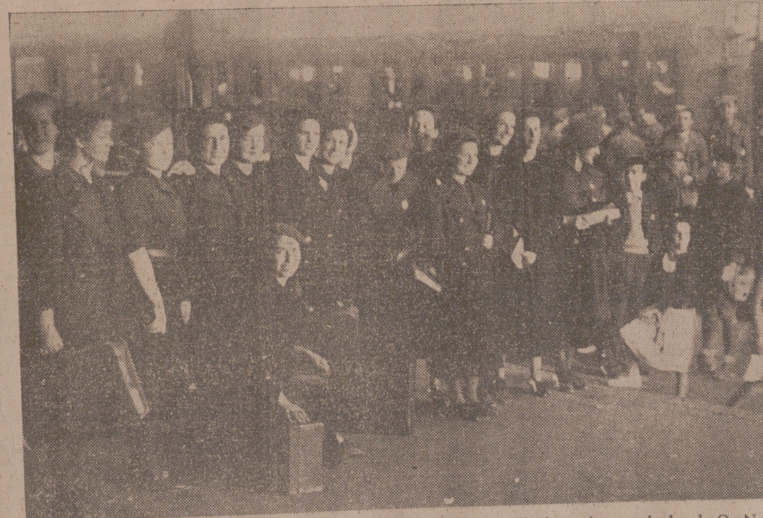
Grupo de camaradas de la Sección Femenina de Falange Española Tradicionalista y de las J. O. N. S. que han marchado a Alemania, invitadas por el Partido Nazi, para estudiar el funcionamiento de las Escuelas del Hogar

Se interesaron muchos estos señores por las aportaciones italianas, admirando la Virgen en alabastro de nuestro delegado en Italia y el magnífico grabado de Bru-