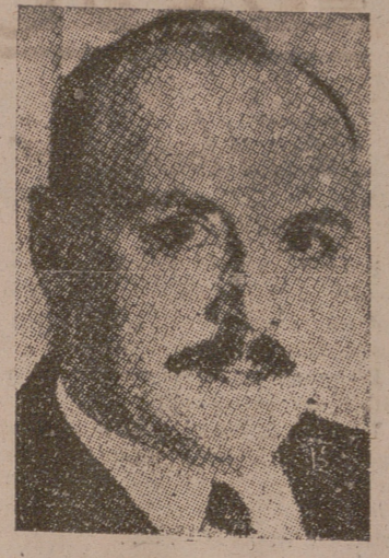
M. PUAUX, alto comisario de Francia en Siria