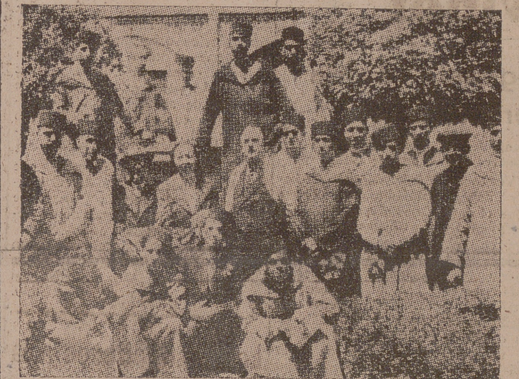
CORDOBA.—Maestros y profesores de las diversas localidades del Marruecos español, acompañados por el profesor Mora, han visitado el Museo Romero de Torres.