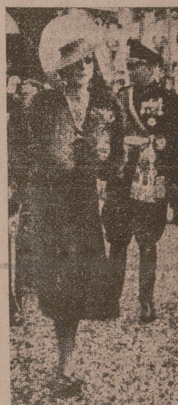
La Princesa Olga de Yugoslavia y el Principe de Piemonte visitando la Exposición del Artesanado en la ciudad de Firenze

Riga.—Según comunican de Moscú a la Agencia Central europea, un nuevo y honorífico título acaba de añadirse a la serie de aquellos que acompañan al nombre de Stalin en los boletines de Prensa, escritores y oradores soviéticos. Se trata del título de "ateo de honor" de la república soviética de la Rusia blanca, solemnemente atribuido por la II. ga de los sin Dios de esta república en el curso del Congreso recientemente celebrado en Minsk.