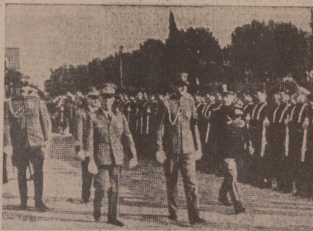
EL REY EMPERADOR REVISTANDO LAS TROPAS

La población se engalana profusamente, lo mismo que el Parque y las fachadas de las casas y establecimientos de la Avenida. — Faro.