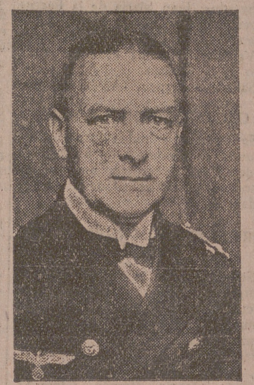
EL ALMIRANTE GENERAL RAEDER (NACIDO EL 24 DE ABRIL DE 1876) QUE FUE HONRADO POR EL FUHRER CON EL BASTON DE GRAN ALMIRANTE EL 12 DE ABRIL