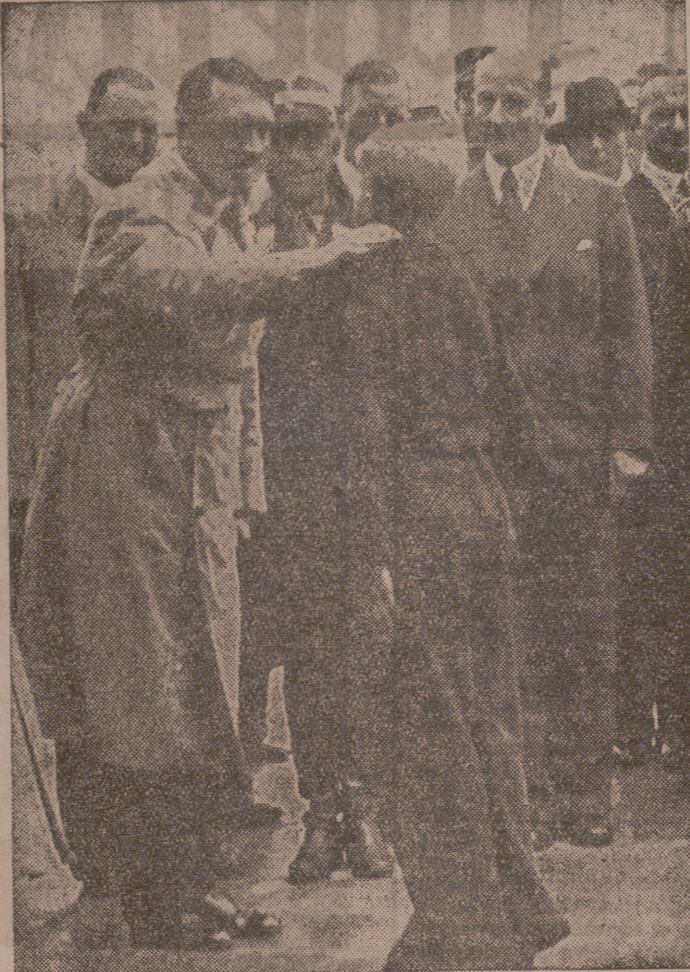
El Führer Canciller dirige la palabra a un muchacho, felicitándole por sus hazañas deportivas