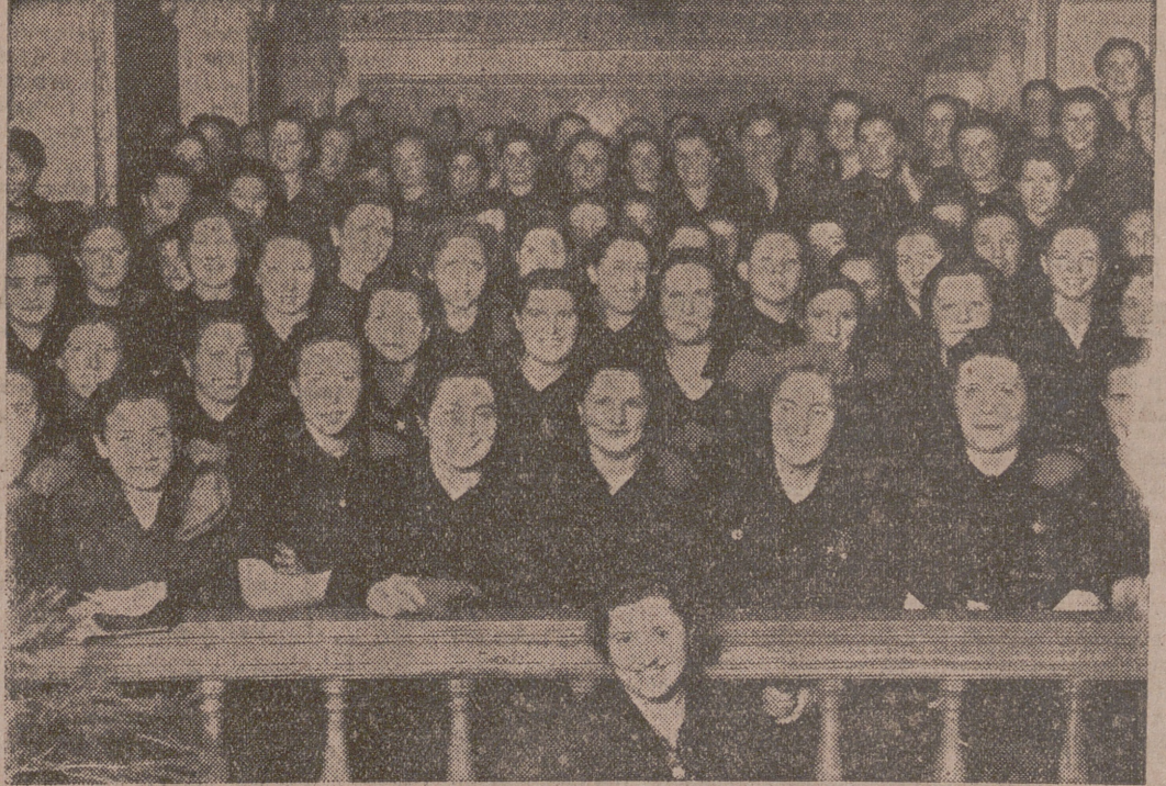
Bajo la presidencia de la delegada nacional, Pilar Primo de Rivera, se celebró en Burgos el Congreso provincial de la Sección Femenina de Falange Española Tradicionalista.—Pilar Primo de Rivera rodeada de las congresistas

Según un proyecto, ya aprobado, por el último Consejo de ministros, cada persona destinada a prestar servicio en una casa está sometida a un control periódico médico, durante el cual se prohíbe contratar y mantener el servicio a cualquier criada que resulte enferma de algún padecimiento infeccioso.