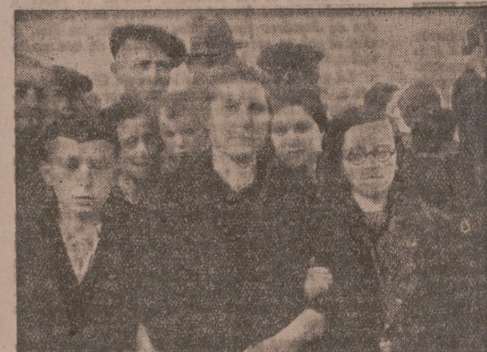
Esta joven de la derecha fué la que salvó la reliquia, llevándola desde Valencia a Carlet, distante treinta y cuatro kilómetros. En este pueblo se la confió para su custodia a la señora que aparece a su lado, la cual la ocultó en su casa todo el tiempo de la dominación roja.