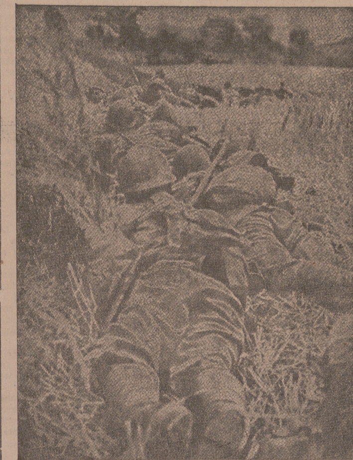
Fuerzas de una división ligera japonesa flanqueando a una columna en las inmediaciones de Dhu-Kal

En esta capital pasará el día de mañana, y a última hora de la tarde se trasladará a Fuenterrabía.— Faro .