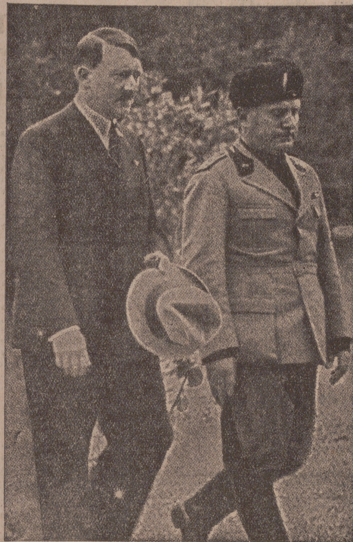
El mundo vive pendiente de las palabras de estos grandes hombres. Frente a la vista política está la decisión de Hitler y Mussolini

Estos habrán de reconocer un día otro que van por mal camino, mientras el fascismo y el nacional-socialismo constituyen el fondo