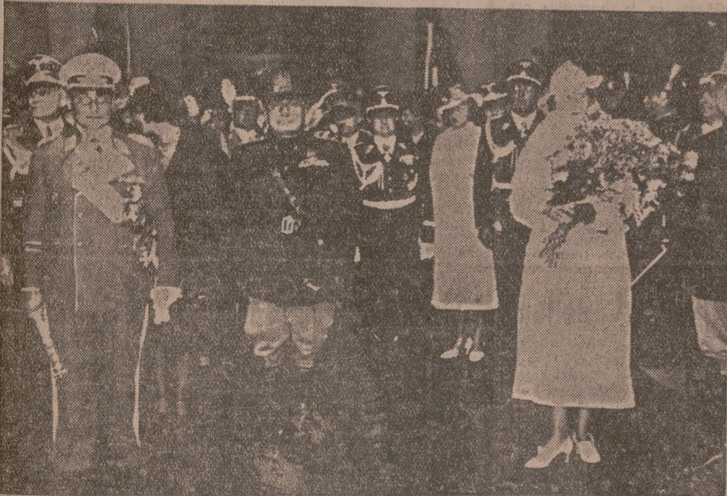
El mariscal Goering y su esposa son recibidos por el Duce en la estación Termini de Roma, de paso para Libia, provincia italiana del Africa, que ha visitado el mariscal alemán invitado por Italo Balbo.