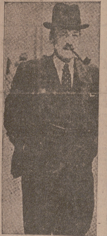
ATLEE, jefe de los laboristas ingleses, uno de los mayores perturbadores de la paz