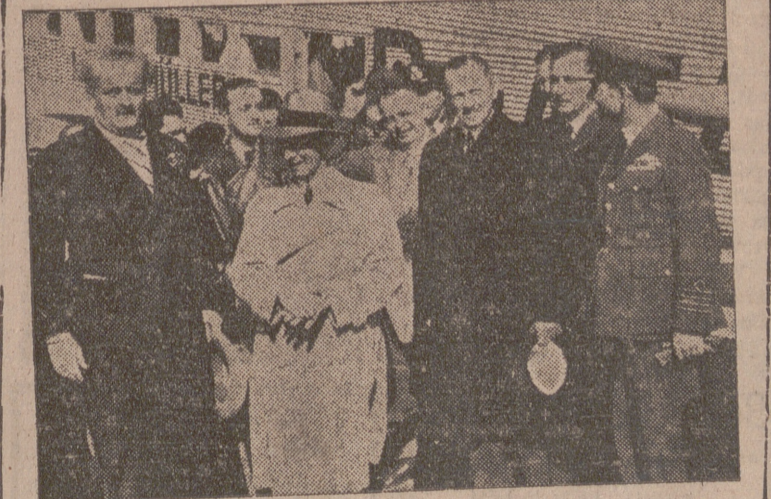
El ministro alemán de Propaganda, Dr. Goebbels, en su viaje al Este de Europa, desoyendo del avión en el aeródromo de Atenas. (A su izquierda, el ministro griego Kotziás)

CIUDAD DEL VATICANO, 14.- EL PROXIMO DOMINGO, DIA 16, A LAS ONCE HORAS, EL PAPA LEERA, POR RADIO, UN MENSAJE DIRIGIDO A ESPAÑA. - Stéfani.