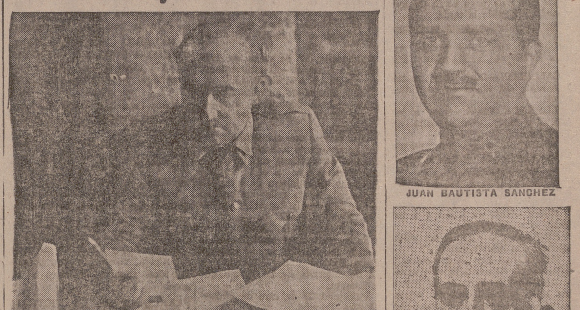
FRANCO, NUESTRO CAUDILLO PROVIDENCIAL, QUE HA DIRIGIDO PERSONALMENTE TODAS LAS VICTORIAS

El Caudillo ha dirigido al Ejército del Norte esta felicitación: