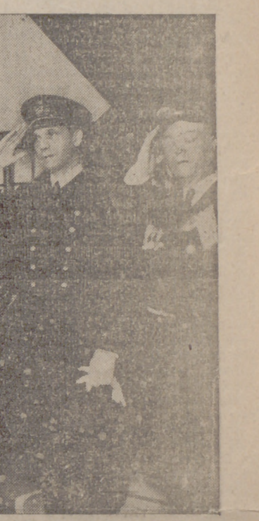
En el nuevo cuartel de marineros, en Alfete (Portugal), se rindió un sentido homenaje a los sergentes muertos en defensa de la Patria. En esta fotografía podemos ver al ministro de Marina y a un grupo de oficiales en posición de saludo.