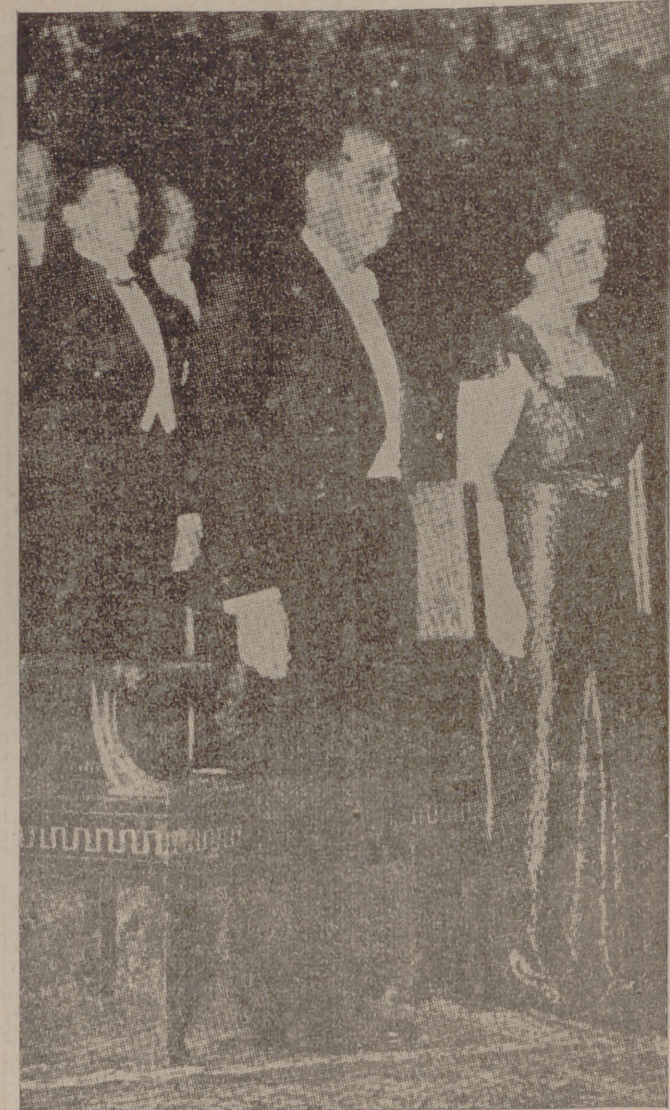
En el Palacio de los Conciertos, de Estocolmo, se entregó solemnemente el Premio Nobel de Literatura y Física. Aquí podemos ver al académico de Italia, Enrique Fermi, y a la escritora americana, Pearl Buck, en la gran reunión.