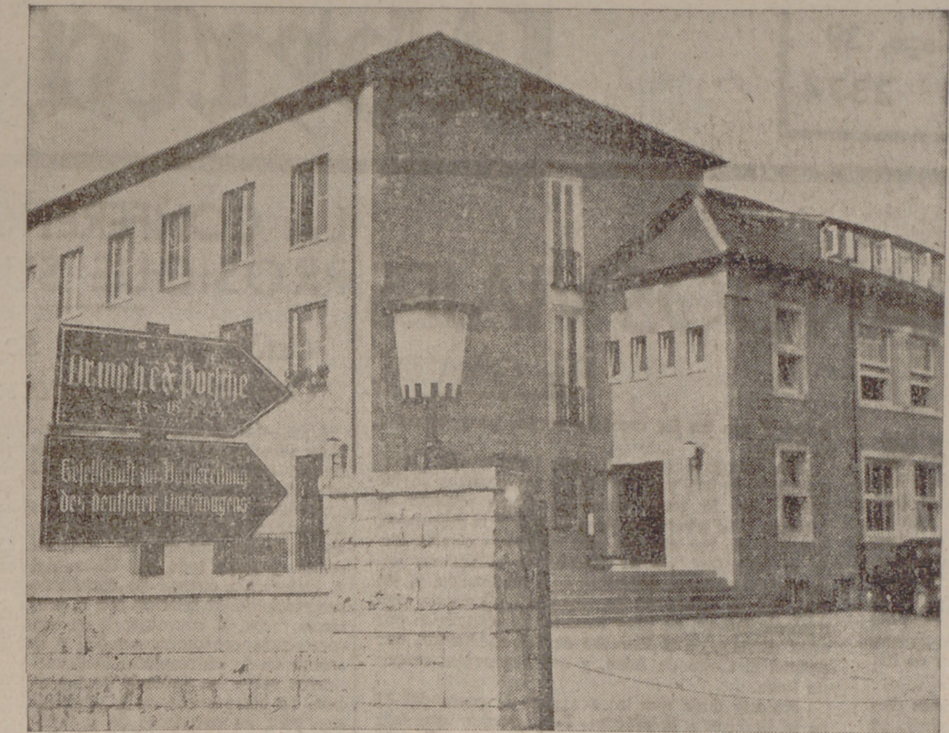
La foto muestra las oficinas de dicha Sociedad que preside el Ingeniero Dr. Porsche. La fabricación en serie empezará en breve