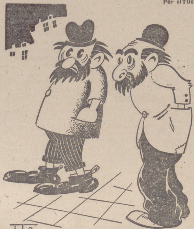
—Pero Samuel, ¿gastas un número tan grande en el caizado? —Hombre, es que vengo de comprar unos terrenos.