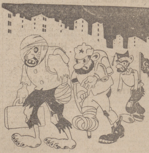
Llegada a Francia de la primera expedición de combatientes.

Embajada italiana en España el Instituto "Per la Apicacione del Calcolo del Consiglio Nazionale delle Ricerche" se ha dirigido al ministro de Educación Nacional con el objeto de ofrecer sus servicios y conocimientos a los investigadores españoles en matemáticas, cuestionarios físico-químicos, etc.