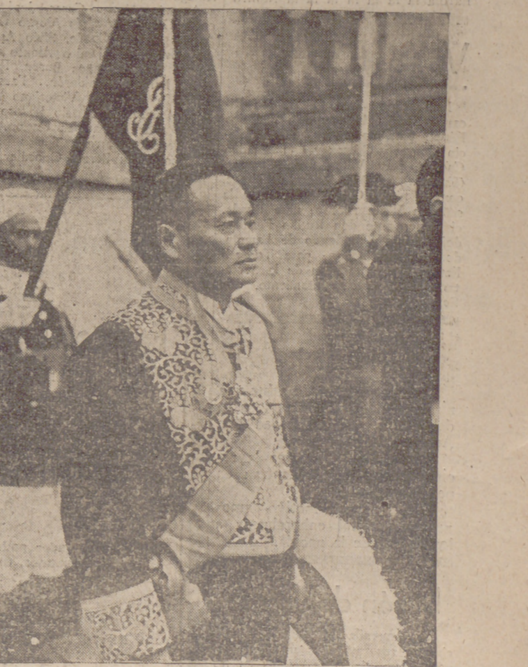
El nuevo ministro del Japón en España en el instante de ir a presentar al Caudillo sus cartas credenciales.

Roma, 25.—En las últimas horas de la noche el médico particular de Su Santidad el Papa ha declarado que no es de temer un fatal desenlace, pues el corazón funciona normalmente y podrá resistir aunque se declarará un nuevo ataque cardíaco.—D. N. B.