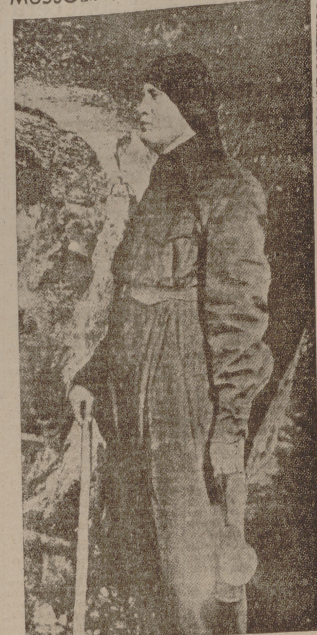
...de una mina. Esta fotografía, en tamaño colosal, está colocada en un muro de la Exposición del Mineral