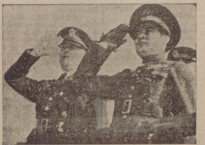
El coronel Batista (a la derecha) junto a un jefe del Estado Mayor americano, presenciando en los Estados Unidos una revista militar en Fort Myer.

"Valor y Fe" Revista de las Congregaciones Marianas Hemos recibido el número 51, correspondiente al mes actual, de la revista "Valor y Fe", que editan las Congregaciones Marianas de San Luis Gonzaga y San Estanislao de Kostka de Valladolid.