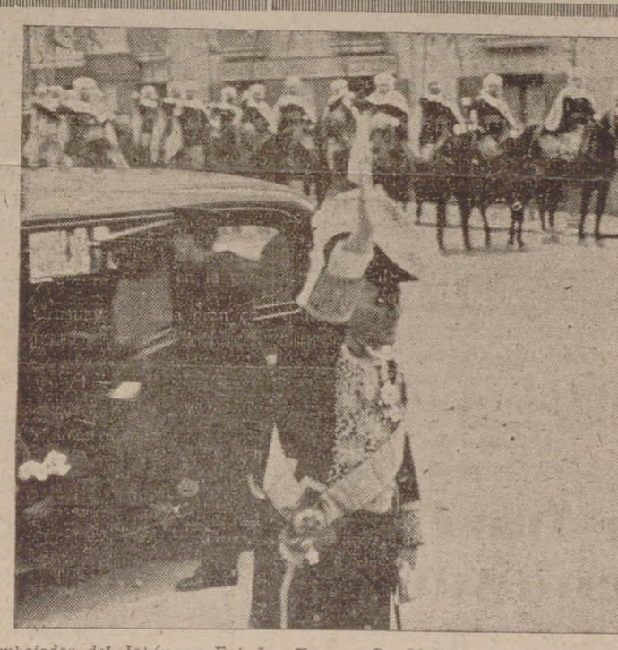
El embajador del Japón en España, Excmo. Sr. Makoto Yano, saludando a las fuerzas que le rindieron honores el día de la presentación de las cartas credenciales en Burgos.