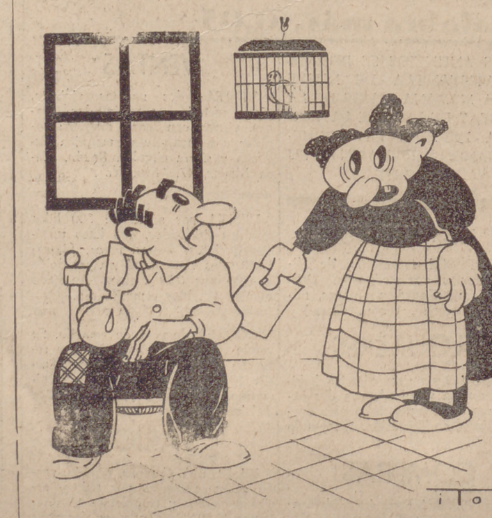
¡Mira la cuenta del gas! ¡Mira lo que nos cuesta tus tentativas de suicidio!!