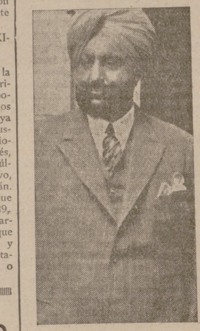
Hace ya algunos años que empezaron a visitar Europa comisiones y distinguidos de la India. En aquellos días sus vestidos fastuosos, sus turbantes y sus ademanes tenían el aprecio de los amantes de lo extraño y exótico. Se les anunciaba a bombo y platillo en la Prensa y luego desembarcaban triunfalmente, asietados por miles de retinas, en algún puerto inglés.

La India entonces tenía sus misterios. En cada personaje se quería ver un trozo de su paisaje cálido, lleno de elefantes y palmeras, y sumido en el romántico "nirvana". Sus barbás patriarcales, sus joyas y sus riquezas eran el tema y servían de cointerim en las mesas de café de cualquier cristalizado salón. Pero el relámpago sólo dura un instante, y la fama, la moda de sus rostros tostados, fué un relámpago que cruzó por Europa y dominó su atención durante un tiempo limitado. Pasaron aquellos días triunfales, y hoy llegan, quizá en los mismos navios, sin ser molestados por nadie. Después de la peregrinación de tantos príncipes sin principado y de tantos emperadores sin imperio, como el Negus, un hombre de la India pierde actualidad.