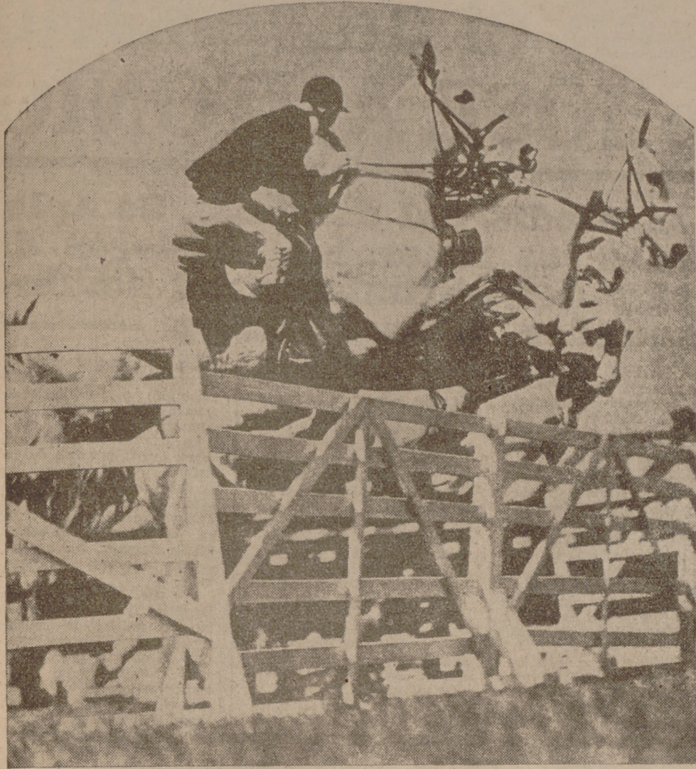
En Australia también los deportes alcanzan hoy un punto culminante. La foto de hoy recoge un interesante momento de la reciente prueba para amazonas disputada en el Hipódromo de Sidney.