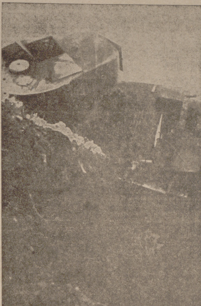
Aspecto de un carro rojo incendiado por los antitropas en las mismas líneas nacionales, a las que pretendió llegar

(De nuestro redactor en el frente F. Baratech)