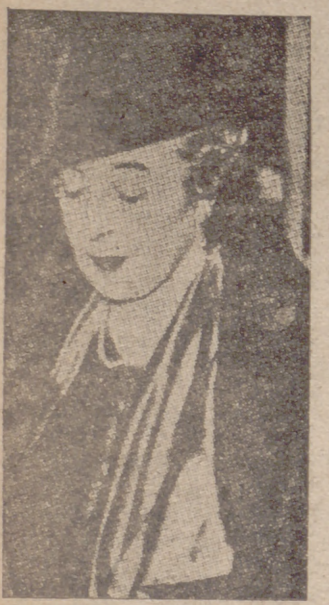
Miss Neville Chamberlain, que acompaña a su esposo en su viaje a París