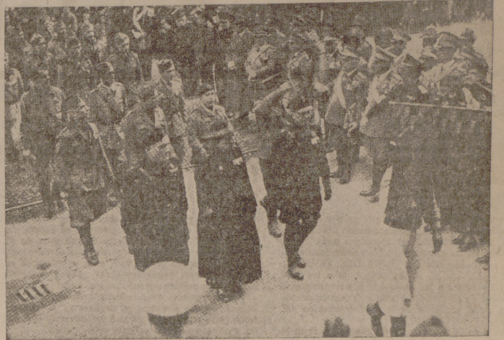
Ante el rey-emperador desfilan los legionarios italianos que lucharon en España

Roma, 8.—La Confederación Fascista de Industriales y Obreros ha confirmado a todos los asociados que los mismos motivos espirituales que en tiempo oportuno indujeron a las Empresas industriales a dar