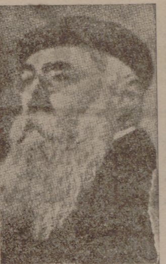
Francis Jammes, el gran poeta francés, fallecido recientemente

Vigo.—Se encuentra en la bahía vizcaína el acorazado alemán "Schleswig Holstein", buque-escuela de guardias-marinas, al que acompaña el buque cisterna "Julius Schindler". El citado navío fué visitado por las autoridades civiles y militares, así como por el gobernador civil de la provincia, a los que se hicieron los correspondientes honores. Los periodistas vizcaínos, gentilmente invitados por el comandante del navío germano, hicieron una especial visita, siendo atentamente agasajados a bordo y mostrándoseles todo cuanto de interés contiene el navío. El acorazado alemán permanecerá en Vigo hasta el próximo día 10.