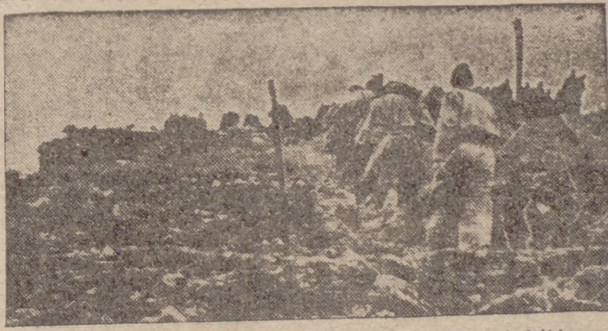
Mora llegaron al kilómetro 12 de la misma y al propio tiempo se extendieron hacia el río. (Pasa a la sexta página)

Las fuerzas que progresaban por la carretera de Pinell a