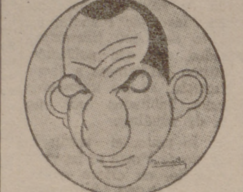
El famoso púgil aragonés, Ignacio Ara, que actualmente triunfa plenamente en América del Sur

En cuanto se conozcan los detalles de la intervención, con sus trajes típicos, de las camaradas de diversas regiones de España, que están haciendo un curso de canto bajo la experta dirección del maestro Benedito, las localidades con seguridad se agotarán. Y los que saben la interpretación que a "Canción de cuna" de la compañía de Bassó-Navarro y conocen la simpatía de Carmen Guerrero, no se quedarán rezagados. Pero sobre todo ello, el espíritu patriótico que hay entre los vallisoletanos será el que hará llenar el teatro. El lunes los buenos españoles de Valladolid probarán una vez más, acudiendo a Lope de Vega, su penetración con nuestros soldados del frente.