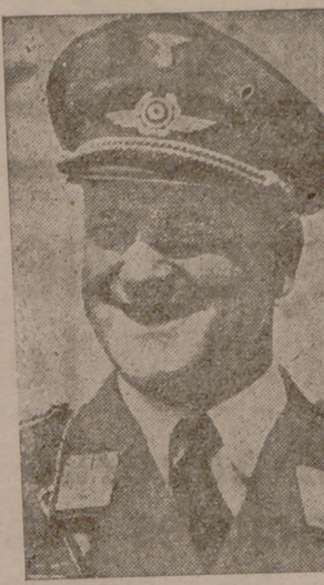
...que ha sido nombrado secretario de Estado de la Aviación alemana