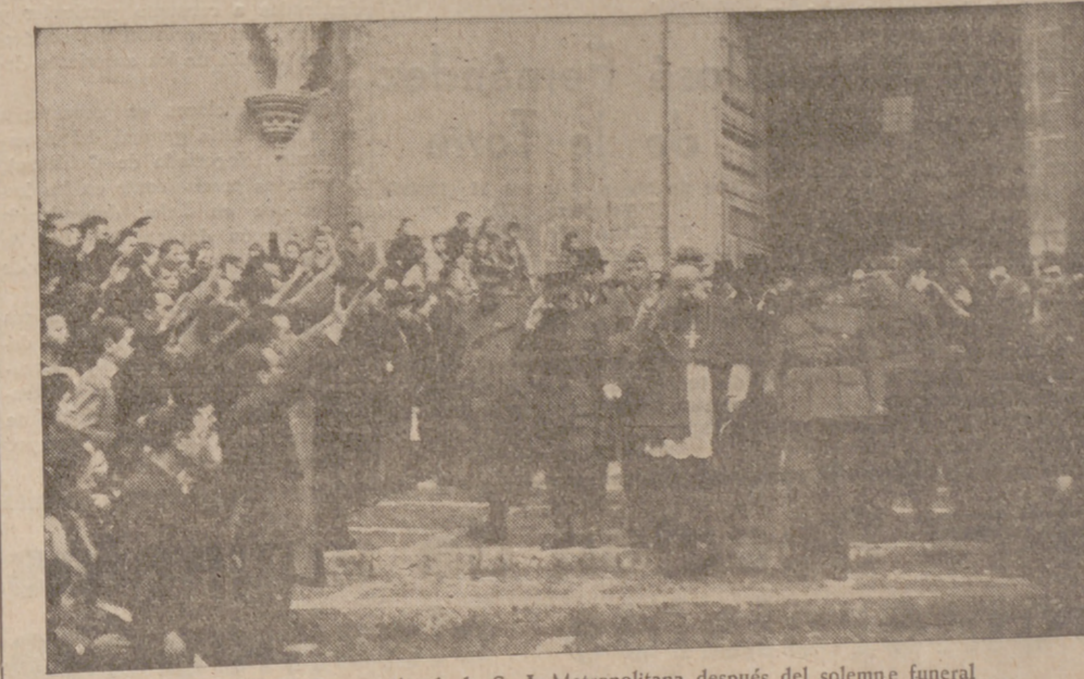
Las autoridades al salir de la S. I. Metropolitana después del solemne funeral