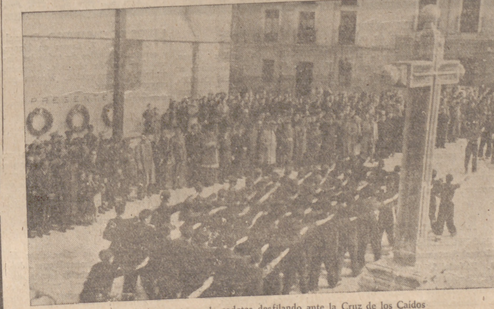
Una de las secciones de cadetes desfilando ante la Cruz de los Caídos