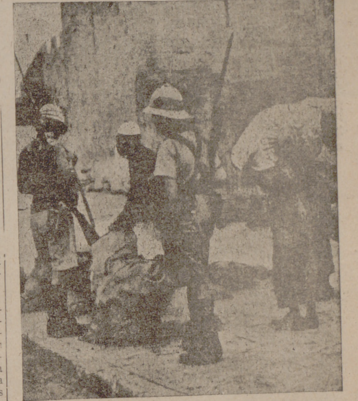
Soldados ingleses que vigilan el transporte de sacos de pan y de harina en los barrios viejos de Jerusalén.

Jerusalén.—Se está preparando, según informaciones que se han recogido en los centros árabes, una campaña nueva contra los ingleses y los judíos. Existen datos que permiten creer que el mando árabe se ha establecido en Damasco y dirige la guerra de Palestina desde esta ciudad. La actividad revolucionaria se concentrará la próxima semana en la destrucción de las comunicaciones por carretera que unen varias ciudades de Palestina, así como la destrucción de la línea telefónica y las centrales de electricidad y gas. También ha producido una gran agitación el hecho de que gran parte de la población árabe que vivía en la vieja ciudad de Jerusalén se ha marchado a los pueblos de los alrededores transportando consigo sus pequeños enseres domésticos. Se anuncia también que los transportes irán a la huelga la próxima semana. El director del colegio italiano "Terrasanta", de Jerusalén, anunció ayer que en el futuro no se permitirá la entrada en los edificios del colegio a los judíos. A consecuencia de esta declaración se produjeron incidentes entre estudiantes árabes y judíos.