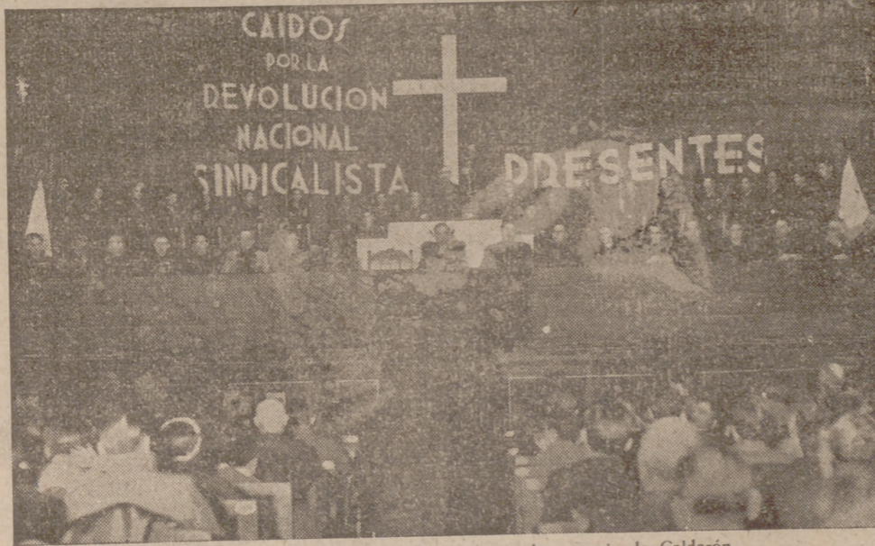
Un aspecto de la presidencia del acto en el escenario de Calderón

Eugenio Montes es nuestro. ONESIMO REDONDO.—LIBERTAD, enero 1935.