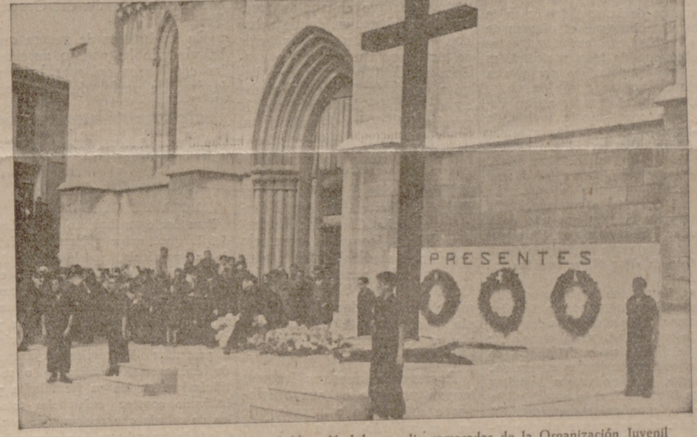
Aspecto que ofrecía la Cruz de los Caídos, dándole guardia camaradas de la Organización Juvenil