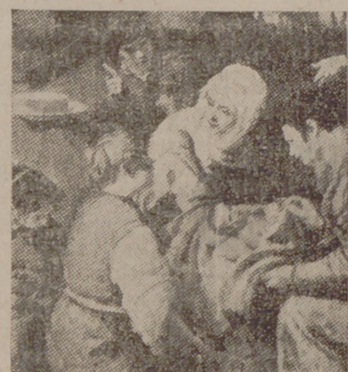
Un trozo del cuadro de Leonardo «La Natividad de la Virgen»

Por fin, después de un estudio de las necesidades exigidas para completar lo he-