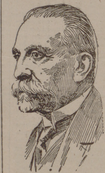
MANUEL LINARES RIVAS

de Linares y Benavente; véase, por ejemplo, la diferencia de sentir el honor en este tiempo y en el de Calderón, y entonces se comprenderán las dificultades para un teatro español propiamente dicho.