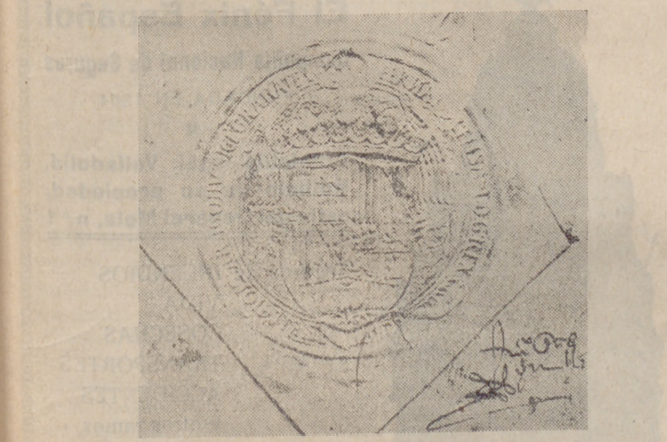
Sello de los Reyes Católicos

probación anterior se añade la existencia de monedas, reales de plata, que muestran en sus caras sendos escudos con las armas de Aragón-Sicilia y Castilla-León, yendo únicamente el de estas últimas sobre el águila, así como su desaparición después de muerta doña Isabel, quedará plenamente demostrado que esta figu-