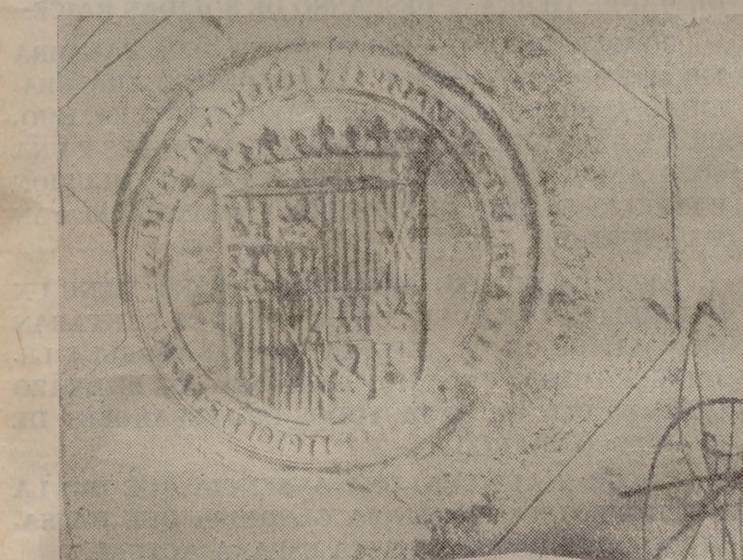
Sello de Fernando V

Así vemos que doña Isabel escogió las flechas y don Fernando un yugo. Aquella no introdujo la inicial en su rúbrica, que ya usaba antes de casarse; pero sí su esposo, que desde entonces rubricó con una Y antes de su habitual Yo el Rey. Esta costum-