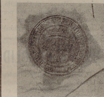
Sello de D. Fernando con las armas de Navarra

tila, León, Aragón, Sicilia y Jerusalén, no persistiendo en los sellos y escudos generales de Corte de sus sucesores.