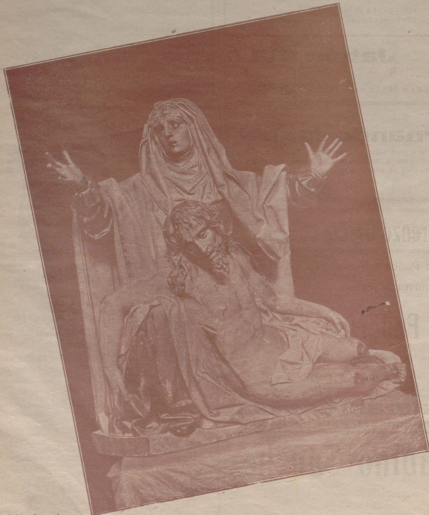
La Quinta Angustia de Gregorio Fernández

Por nosotros España será poderío prestigioso y altísima potencia civilizadora. Con ellos sería arrabal hediondo de los siervos de la Internacional comunista judío-masónica, a las órdenes de algunas republicanas e imperiales potencias extranjeras, bien conocidas del verdadero pueblo español.