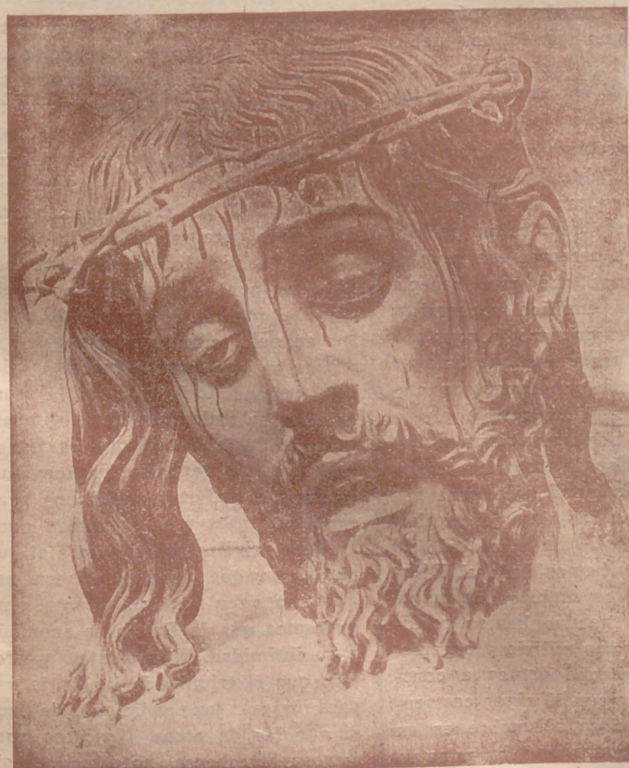
Detalle del Cristo de la Luz de Fernández

Y así como Jesús se nos muestra bajo esa triple corona, amable durante los días del destierro, terrible el día del juicio y adorable en la gloria de su reino, la Falange fué simpática y agradable cuando se la perseguía; será temible a la hora del juicio; y será adorada en la España una, grande y libre. En la ley de Dios, que es la de la Falange, por la cruz del sacrificio se llega al trono de la gloria y del imperio.