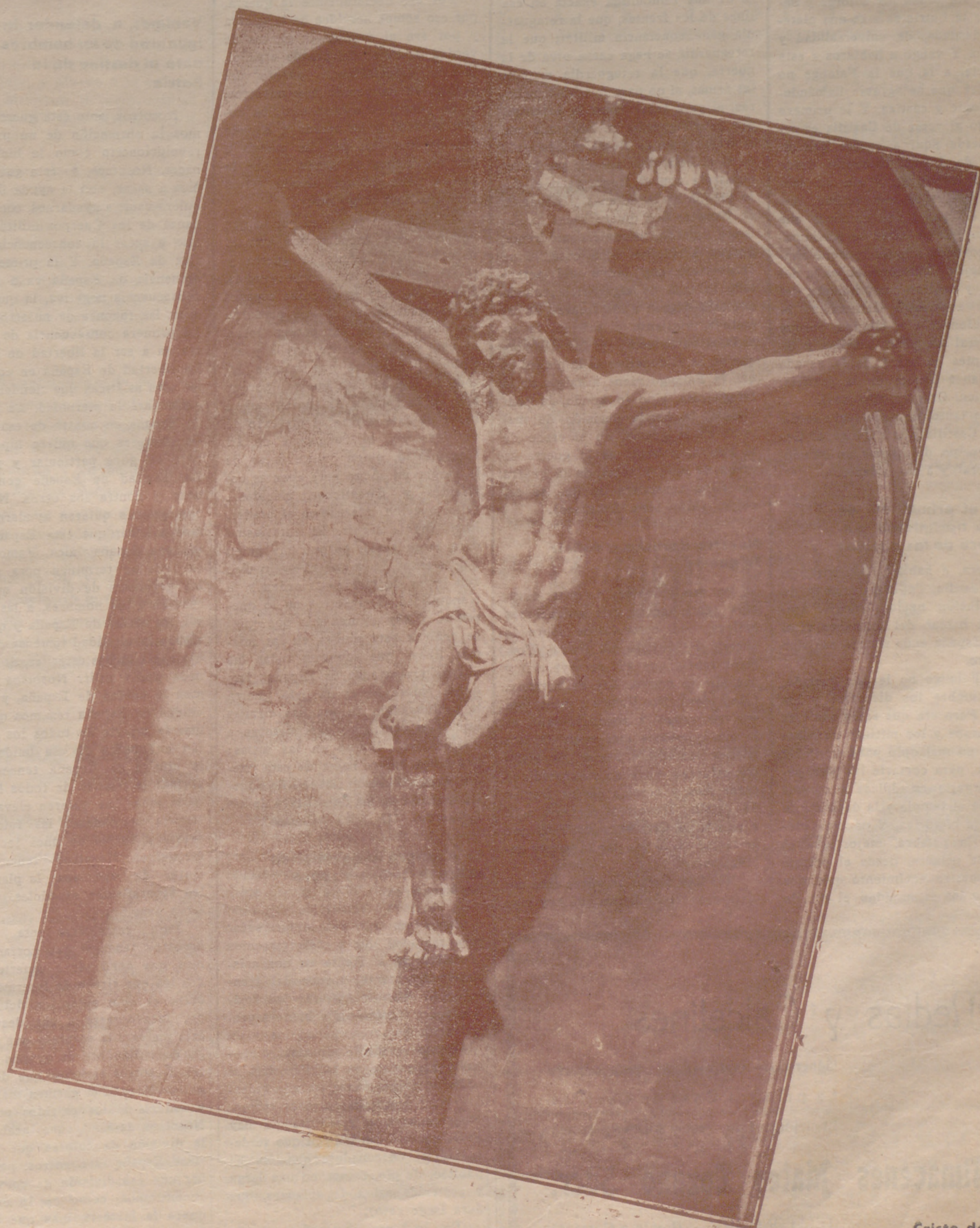
Cristo de Juni

Las aureas del Renacimiento trajeron otras inspiraciones y otros modelos. Y nuestro arte, con los albores del XVI, dulcificó aquellos semblantes de los viejos Cristos medievales, labrando con los cincelos de sus más preclaros imagineros—castellanos y andaluces, especialmente—, esos Cristos magníficos, que son hoy joyas deslumbrantes de la imaginería cristiana universal.