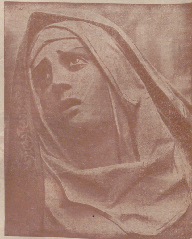
Detalle de la Piedad de Fernández