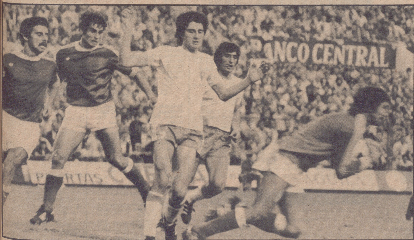
Amador lo paró casi todo. Y en el banquillo estaba Deusto, otro guardameta de categoría. Unos tanto y otros tan poco...