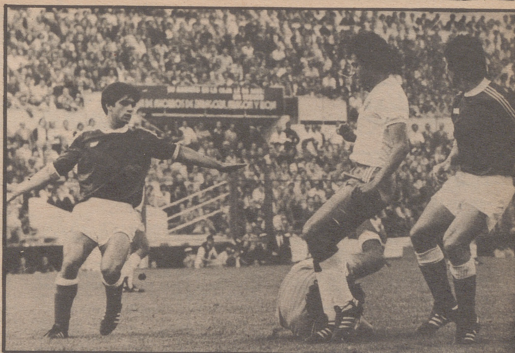
Los del Hércules montaron una muralla casi inexpugnable