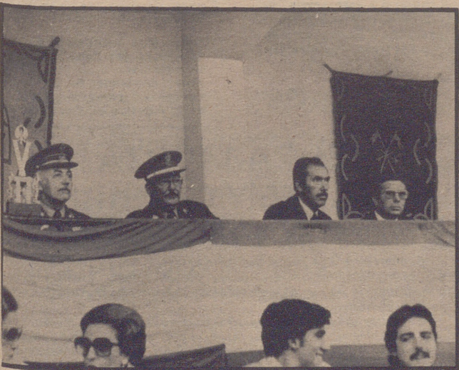
Las pruebas hípicas del sábado fueron presididas por el capitán general de la V Región Militar don Manuel Cabeza Calahorra.

En las instalaciones de la Sociedad Hípica terminó ayer la tanga de concursos de saltos que se ha venido disputando durante estos días con numerosa afluencia de aficionados.