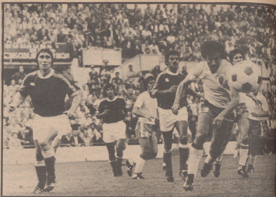
Amorrortu al ataque, pero no tuvo suerte