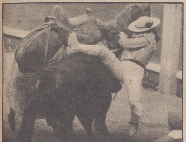
La corrida de la Prensa en Madrid

SUPLEMENTO TAURINO DE ARAGON/expres • Coordina Benjamín Bentura Remacha MARTES, 20 DE JUNIO DE 1978 - Nueva época - N.º 18