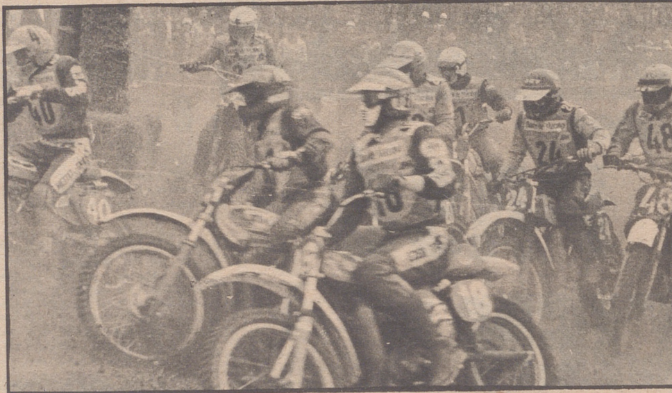
Trepidante salida de una de las mangas corridas ayer en el circuito de Tarrasa.

Mucha animación y expectación para presenciar de cerca este acontecimiento del motocross en el que se han dado cita los mejores pilotos del mundo, encabezados por el actual campeón mundial el soviético Moiseev, que tan sólo en la segunda manga disputada, estuvo a la altura de su fama por cuanto en la primera no tuvo mucha fortuna por averías mecánicas en su motocicleta. Aceptable la actuación de los españoles Ribo y Elías, que alcanzaron una buena clasificación.