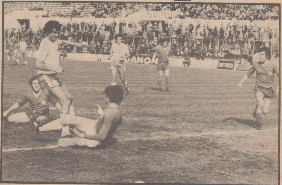
Juego a ráfagas y no demasiado bueno. El Aragón no brilló porque los de Sariñena supieron tomar la medida de sus hombres clave.