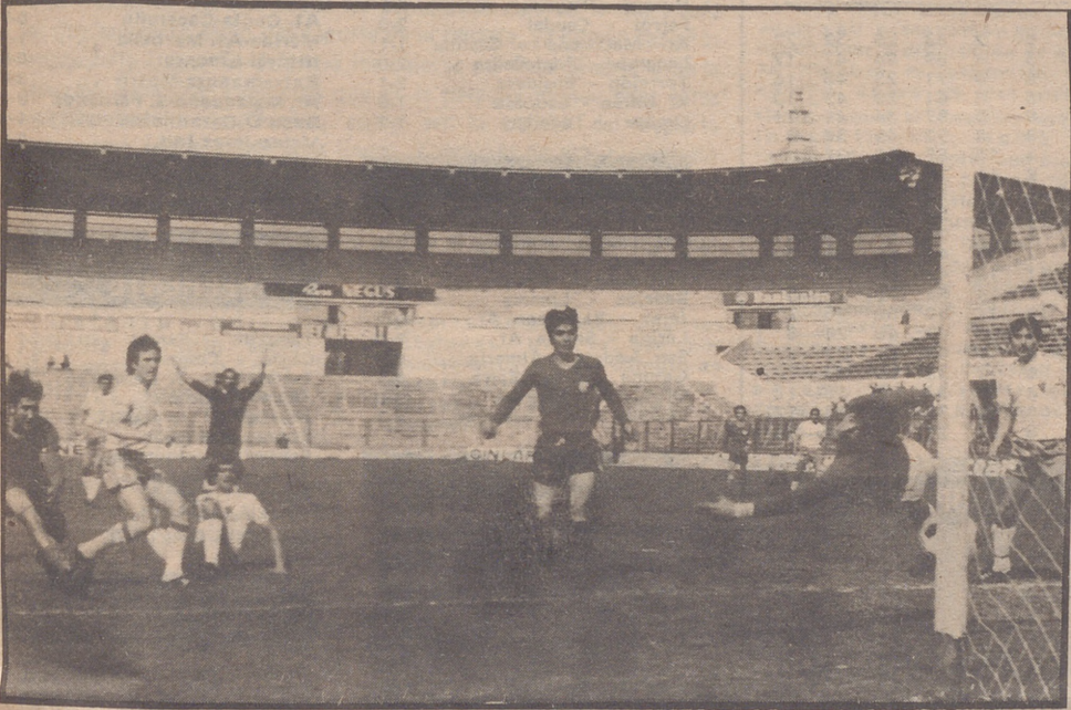
Disparo aragonésista y gol que se cuelga en la red por debajo del meta del Sariñena.