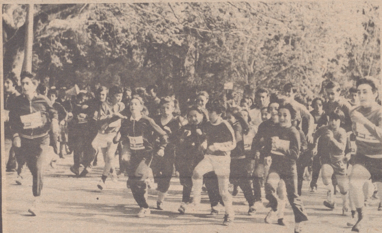
En el Parque, se celebró ayer la jornada de promoción deportiva, organizada a nivel nacional. Fue un día para el optimismo. Un día para soñar en un deporte popular, con arraigo en el alma del pueblo. En la foto de García Luna, vemos la salida multitudinaria de un maratón... Un maratón hacia el mañana...