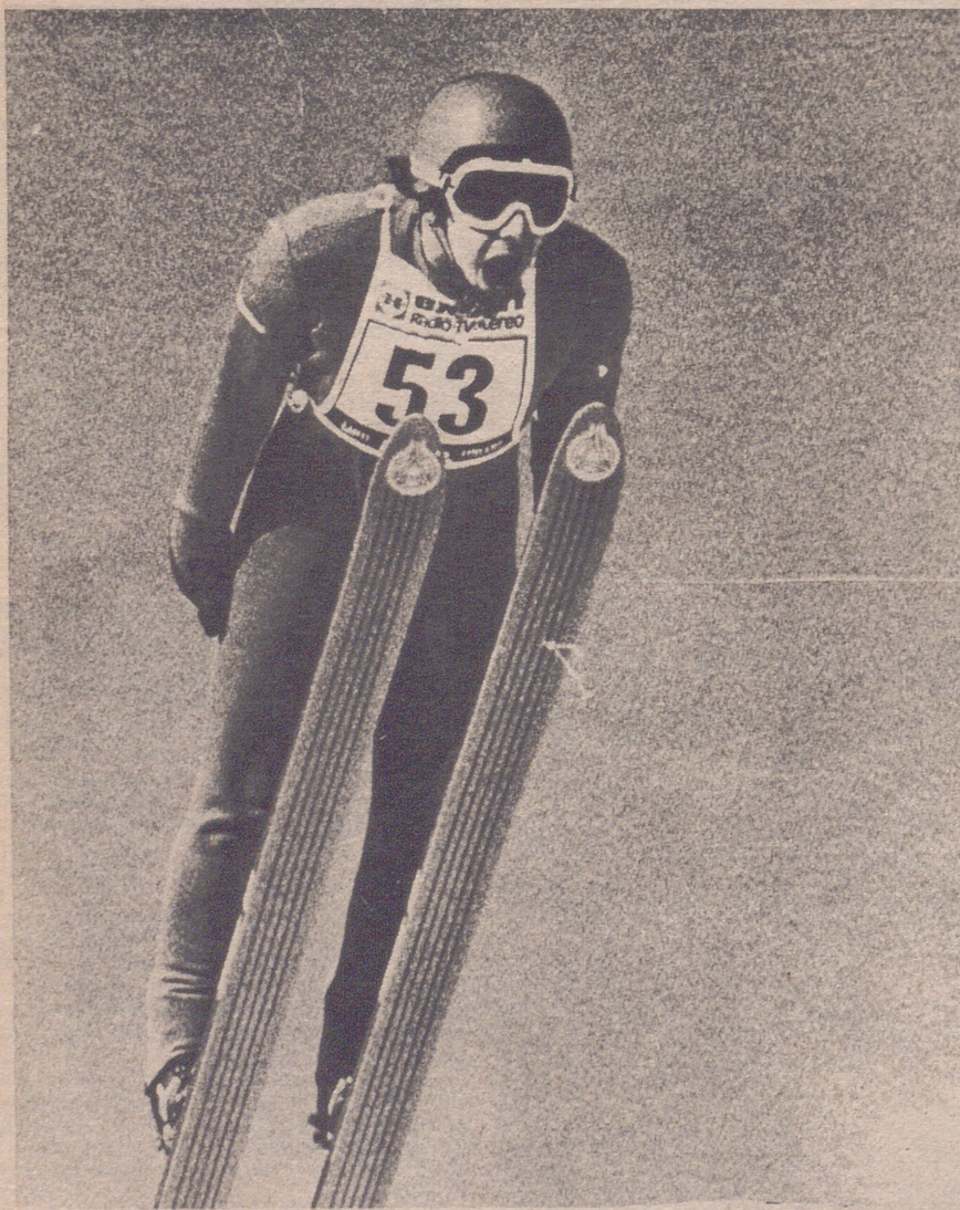
LAHTI. — El alemán oriental Mathias Buse ha ganado la prueba de salto en trampolín de 70 metros, correspondiente a los Campeonatos Mundiales de Esquí de 1978.