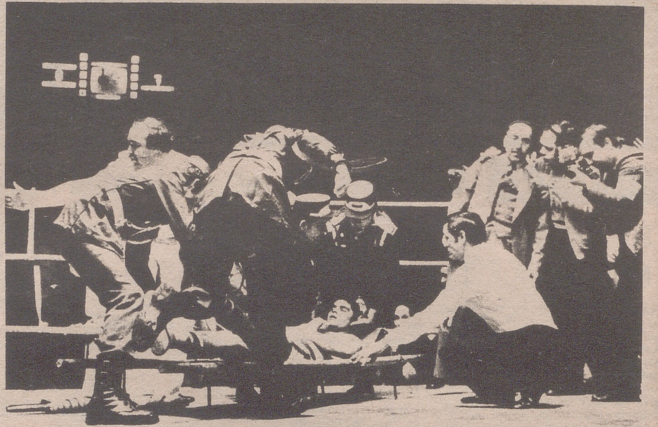
precisamente por la larga inactividad debida al servicio militar.