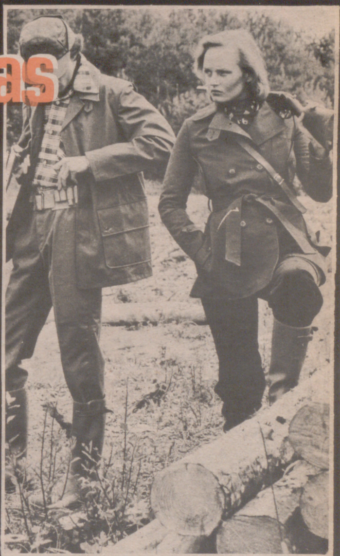
Para él, conjunto de caza de chaqueta y pantalón en loneta kaki, puro algodón. Para ella, chaqueta en gabardina verde de algodón, con pantalón de pana. Modelo Kemo y Norbert Nel - París.

"ella" a base de una prensa suelta hechura "camisa" de una fila y bolsillos-bolsas con pantalón de idéntico tejido, completándose con grueso "pull" en lana blanca, cuello cisne. Para "él", holgada chaqueta y pantalón en pana de grueso bordón color marrón. Camisa a cuadros en franela encima del jersey "cisne" de la lana marrón" Así vestidos -unas y otros- les deseamos... buena puntería.