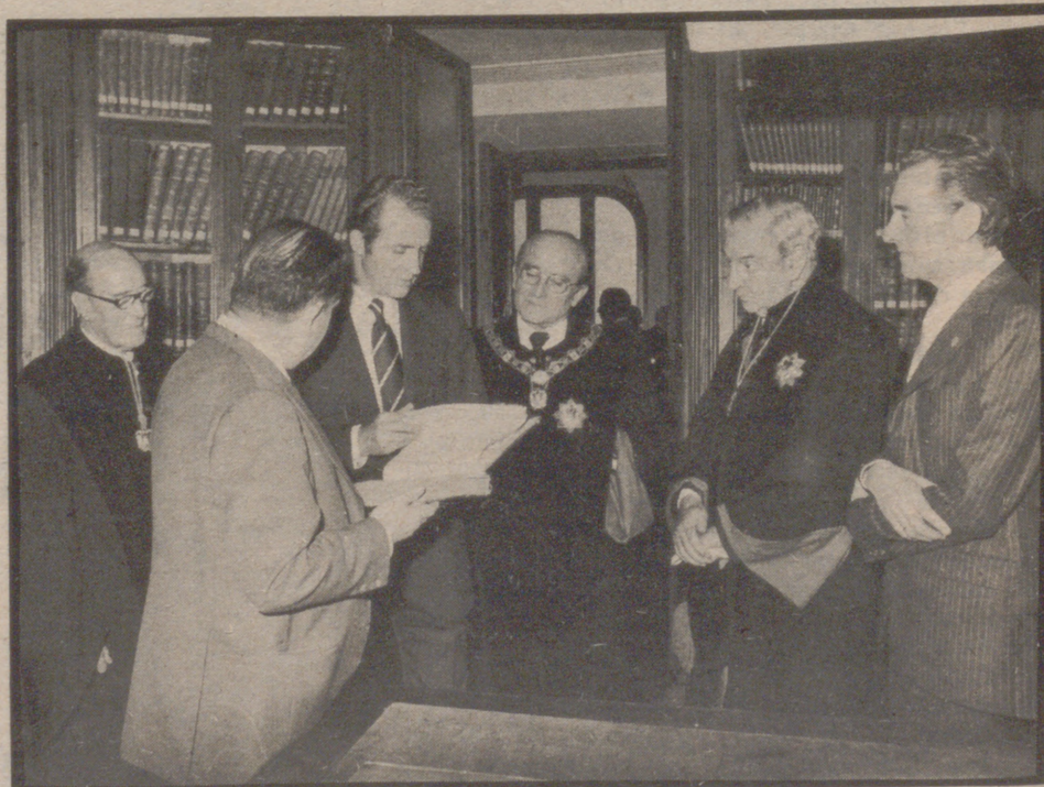
Imagen de don Juan Carlos de Borbón, junto al señor Oriol y Urquijo, y otros miembros del Consejo de Estado, tras la visita girada a dicha institución por el Príncipe de España.