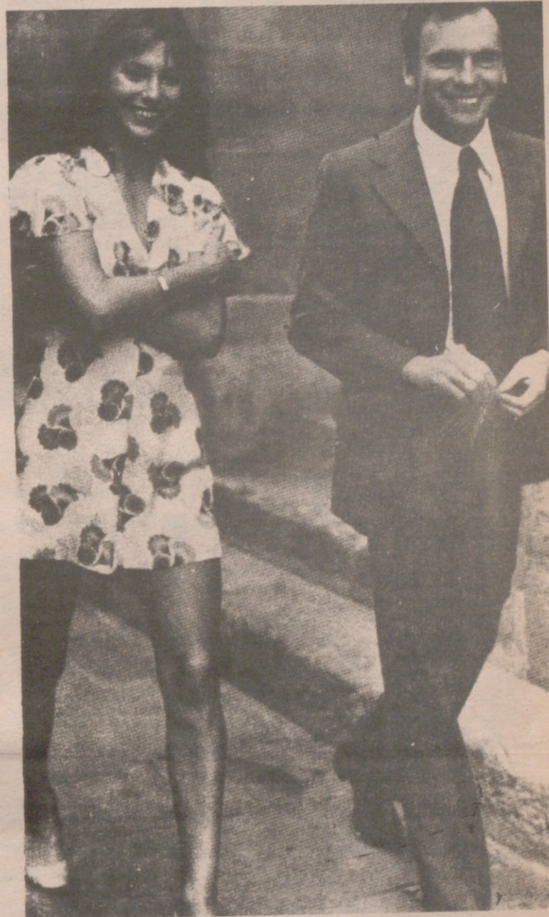
JANE BIRKIN - JEAN-LOUIS TRINTIGNANT

Después de una serie de ejercicios preparatorios de los cuales el primero consistirá en dimitir. Nicolás, cordero de nacimiento, va poco a poco con la ayuda de Dios y de Fabré, convirtiéndose en león, de perdedor, se convierte en vencedor. Partiendo en busca del descubrimiento y de la conquista de un mundo nuevo para él, el de los negocios, la prensa y la política, conocerá en todas partes, deslumbrantes acontecimientos — y las mujeres, inevitablemente no estarán ausentes. Película optimista pues? Bastaría con atreverse. Atreveos y triunfareis! La felicidad y