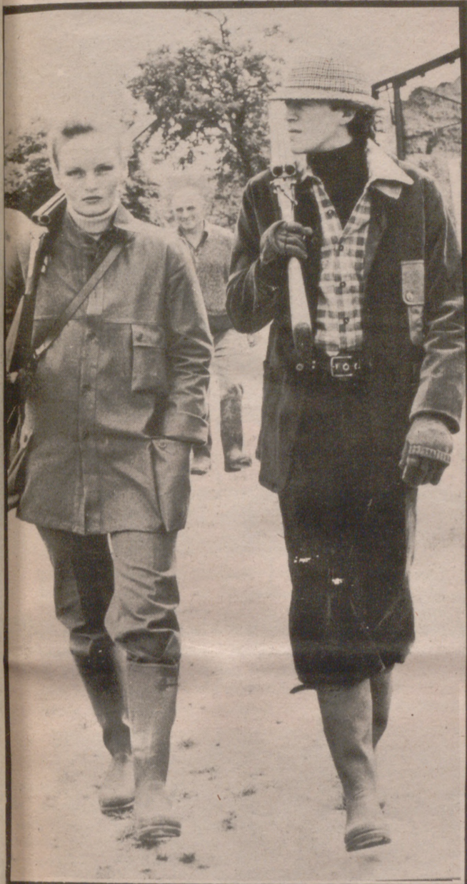
Dos conjuntos para la caza. Para hombre, en pana de bordón, puro algodón marrón. Para ella, en lotona kaki, puro algodón. Modelos Michel Schreiber - París.

Los vestidos en tricot, todos en general, tiene una continua atracción. Para nuestro comentario hemos elegido un clásico modelo "sportwear" con cuerpo en canalé, falso canesú y falda de pliegues. En este caso es "casi" un "camisero" puesto que es abierto y abotonado de arriba a abajo. Escote en V y grandes bolsillos de parche. El modelo que les ofrecemos va en beige. El mismo modelo se muestra también en los colores antes citados. Y todos son fracamente bonitos.