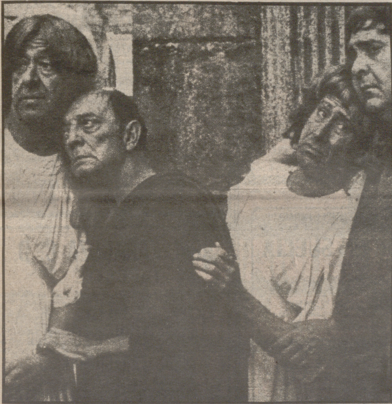
Una escena de "Golfuls de Roma", genial película cómica, con dos "grandes" del género: Buster Keaton, como actor, y Richard Lester como director.