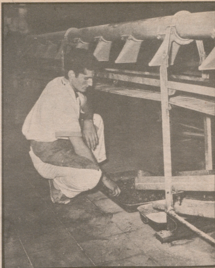
Un obrero ciego de la fábrica de caramelos de la O.N.C.E.

Escribimos también normalmente a mano. Lo hacemos con un punzón y marcando punto por punto.