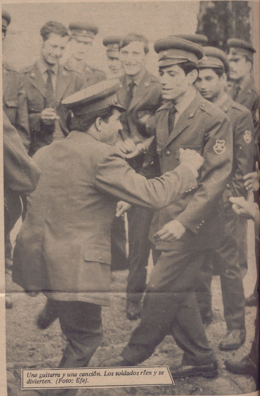
Una guitarra y una canción. Los soldados ríen y se divierten. (Foto: Efe).

Mientras que en 1949, frescas todavía las heridas de la II Guerra Mundial, el número de matrimonios, con 107.820 significaba un porcentaje de 11,7 por cada mil habitantes, y el número de divorcios fué de 12.556, en 1970, en el que se mostraban evidentes los primeros efectos de lo que por muchos observadores occidentales han sido calificados de "boom húngaro", la cifra de matrimonios descendió a 90.552 que representaban un porcentaje de 9,3 por mil habitantes y el número de divorcios se elevó a 22.900. Circunstancias paralelas se producen en esas dos décadas en lo que respecta al número de nacimientos: 190.398, en 1949, y 151.714, en 1970. La tasa actual de natalidad con 3,7 por mil, está considerada como una de las más bajas del mundo y en lo que respecta a la de mortalidad infantil, que ha experimentado un notable descenso desde 1949 en el que era de 91 por mil habitantes, todavía con 35,7 en 1970, continúa siendo elevada. A ello se une el número de 207.000 abortos, en 1969, autorizados.