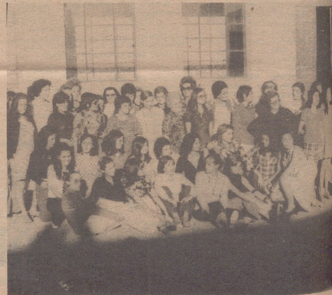
Algunas de las numerosas alumnas que asistieron al "I Cursillo de Formación Cultural de la Mujer", entre quienes aparecen las señoritas componentes del profesorado.

Finalmente, la Caja de Ahorros Monte de Piedad de Zaragoza Aragón y Rioja ofreció un espléndido lunch en el hotel "Cinco Villas" a las señoritas del profesorado del Cursillo e invitados, como despedida de tan ilustres profesoras. Se entregó un broche final del acto de clausura.