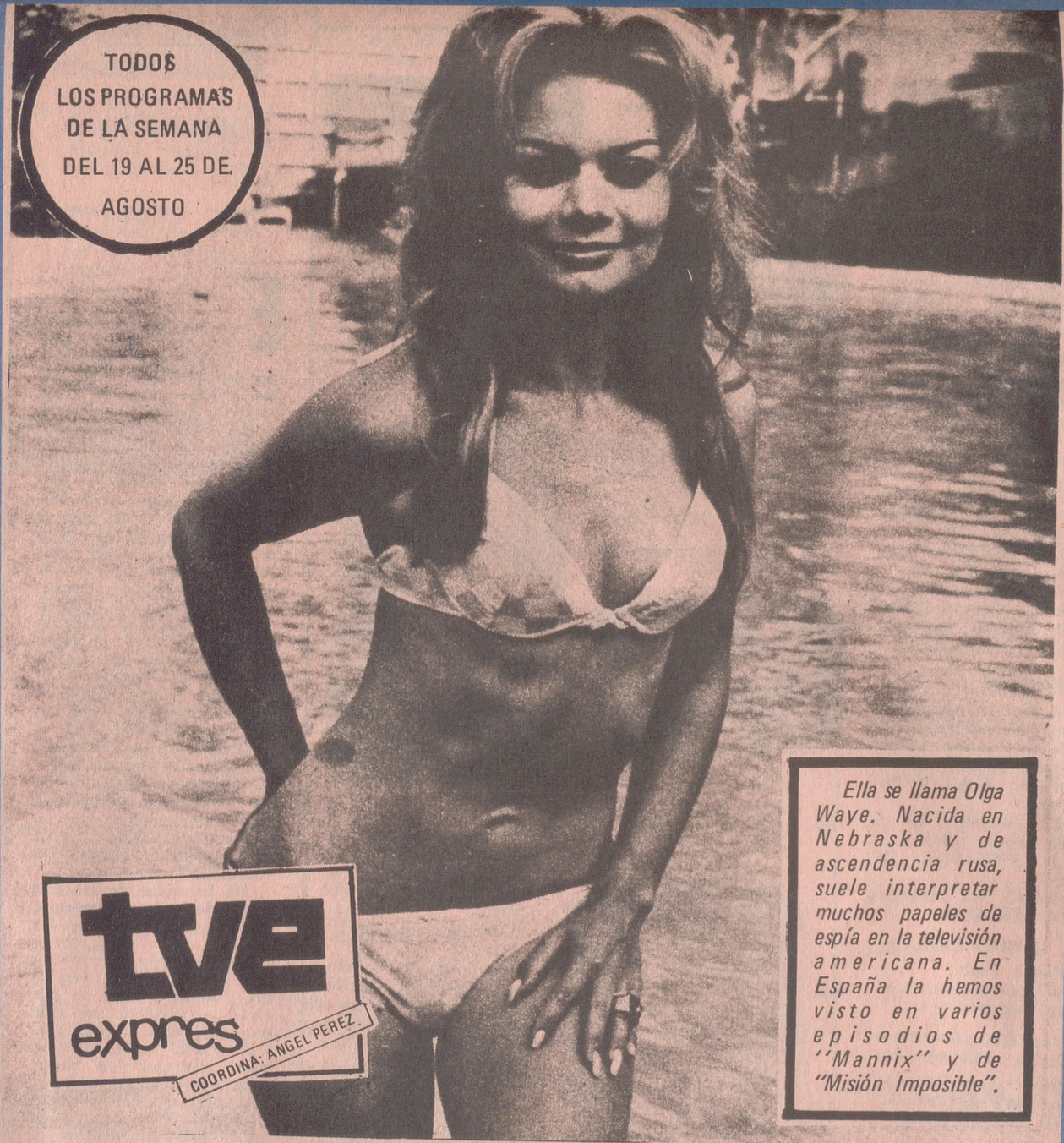
Ella se llama Olga Waye. Nacida en Nebraska y de ascendencia rusa, suele interpretar muchos papeles de espía en la televisión americana. En España la hemos visto en varios episodios de "Mannix" y de "Misión Imposible".

TODO$ LOS PROGRAMAS DE LA SEMANA DEL 19 AL 25 DE AGOSTO