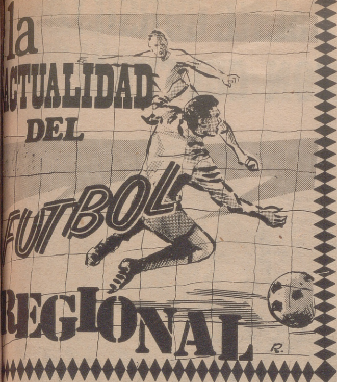
Por Daniel BARAJAS