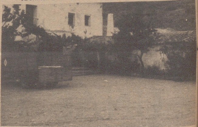
Vista parcial de la vieja Venta del Huerva.

Vemos que aquí las cosas permanecen como hace cuarenta años. Animo amigos y si ustedes son amantes de nuestras tradiciones y desean recordar unos tiempos, que no volverán, vayan a La Venta del Huerva donde les auguramos una agradable jornada.