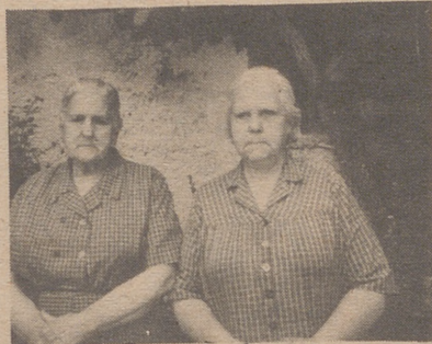
A la izquierda, la ventera y su hermana.

Desde Teruel a Zaragoza y en la mitad del camino entre Daroca y Cariñena, aun existe una venta antiquísima, quizás la única que prevalece intacta en este trayecto y en muchas rutas de Aragón: es La Venta del Huerva. Su atractivo y su historia nos impulsan a presentarla a los lectores de "ARAGON/express" como una reliquia de la época en que el carro, rey de la carretera, llenaba la gran explanada aledaña y el carretero, al amor de la brasa y a la luz de un candil, ocupaba su silla de anea en espera de saclar su sed con un buen trago de vino y mitigar el cansancio con una suculenta ración de ternasco.